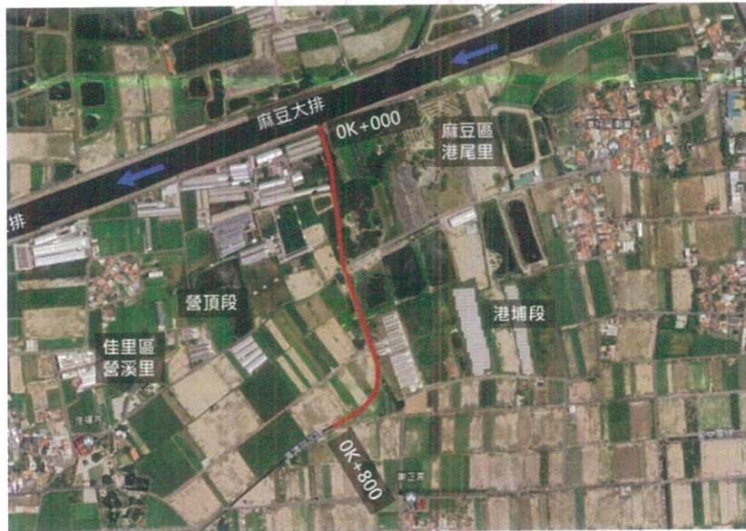
圖 1 本計畫位置示意圖