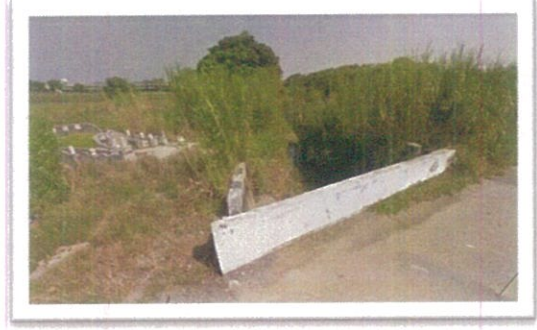
橋長及梁底高程不足