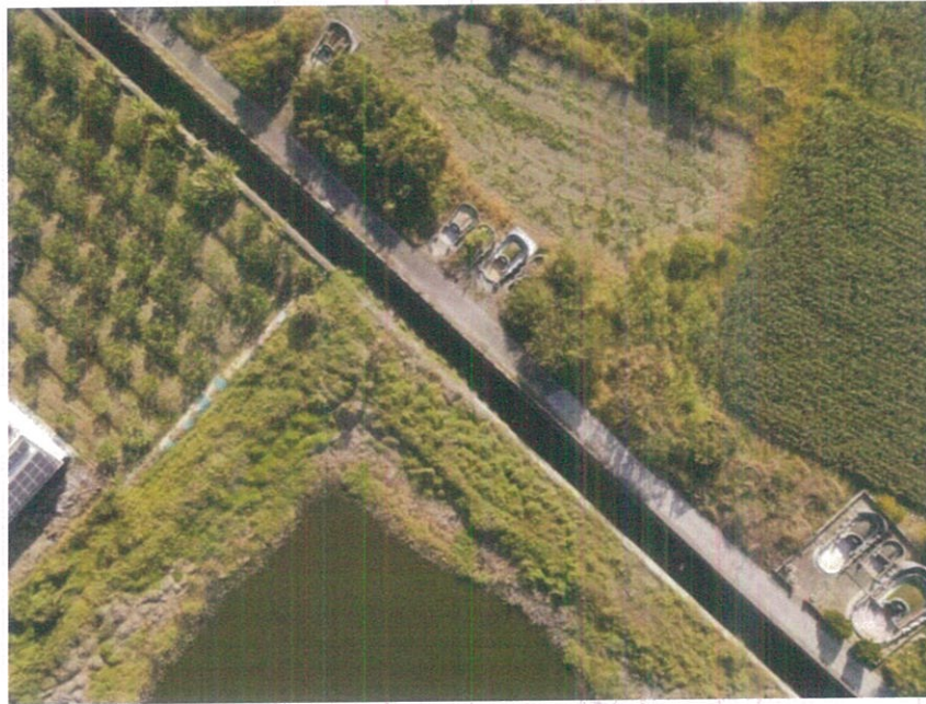
圖 3 現況空拍圖