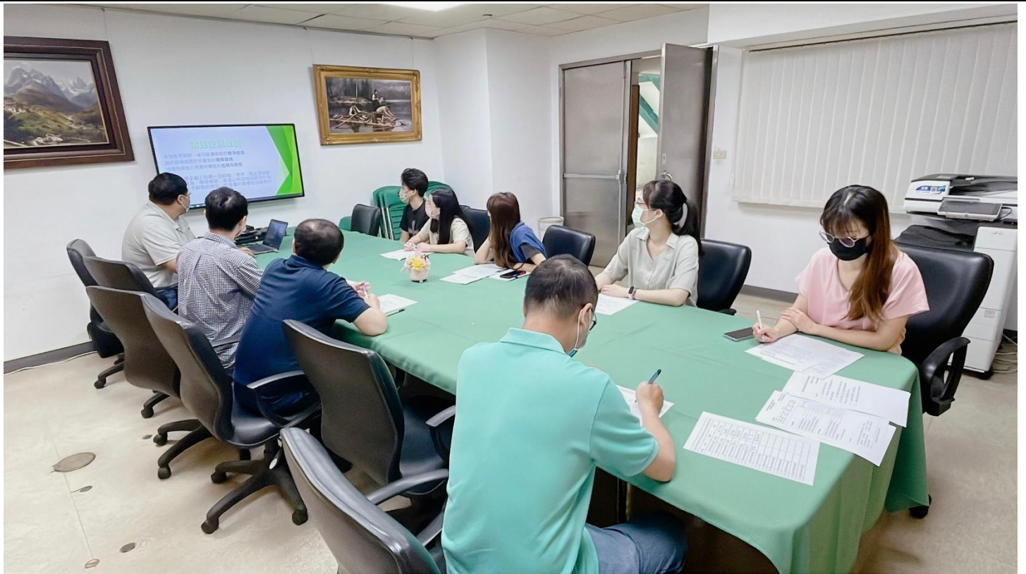
主講者介紹職場上常見的性別歧視