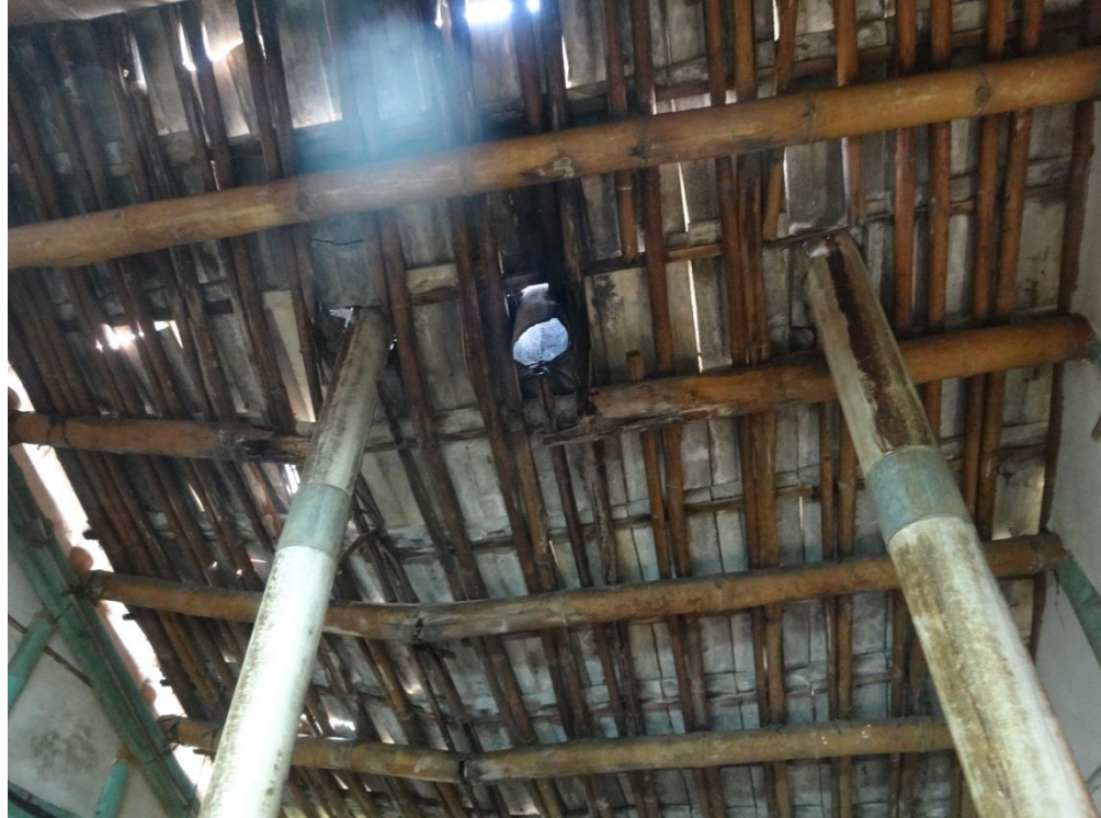
屋頂部分脆弱易塌