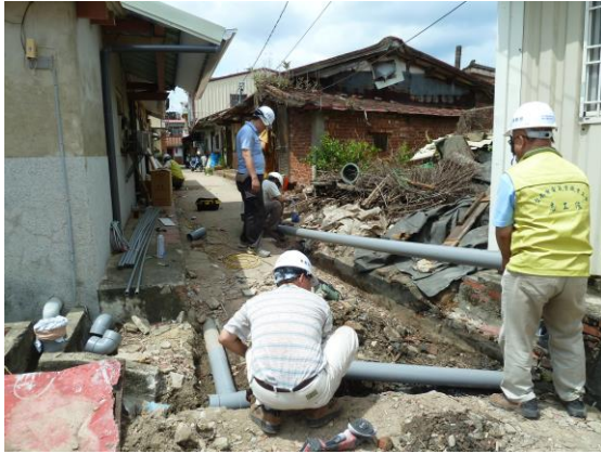
設置廚房排水系統