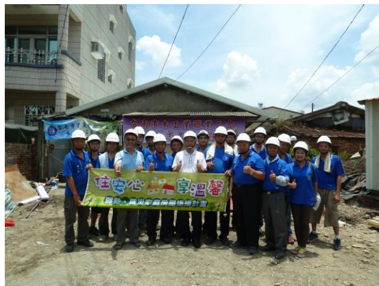
台南市木工業職業工會