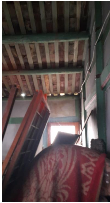
第三間房-屋內堆積 雜物