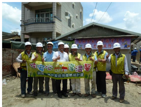
臺南市電氣業職業工會