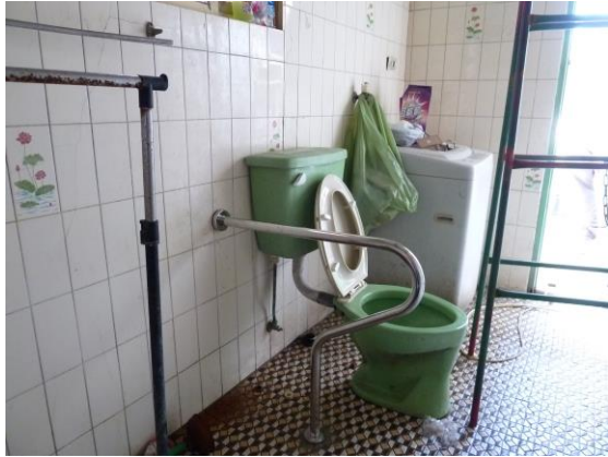
浴室-更換馬桶座及增設扶手