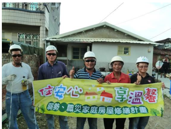
台南市金屬建築結構 及零組件製造職業工會