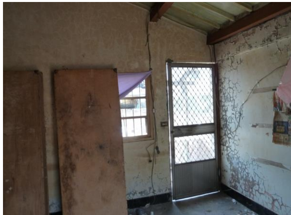
第一間房-牆面斑駁會滲水