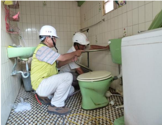
更換馬桶座及設置扶手