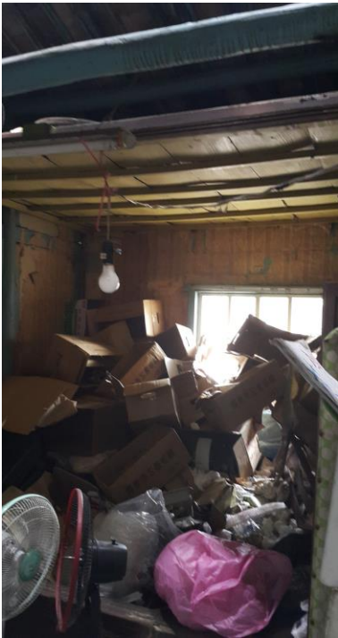
第二間房-床板破損、 堆積雜物