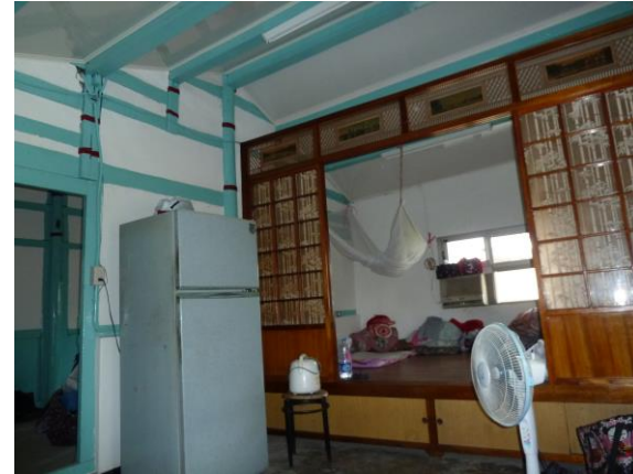
第一間房 (目前為起居室)