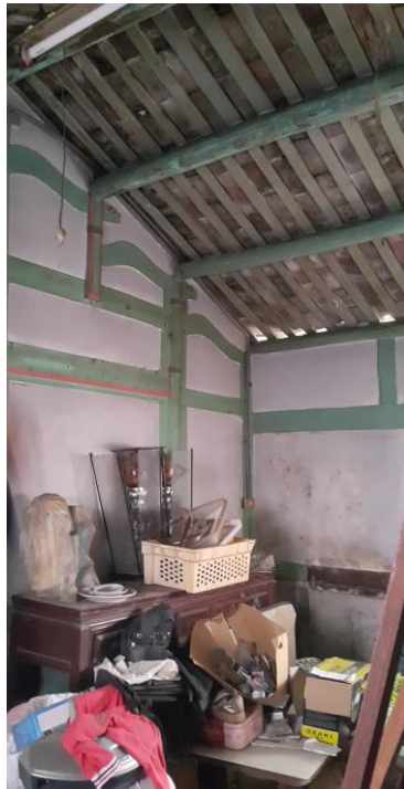
第三間房-屋頂老 舊會漏水