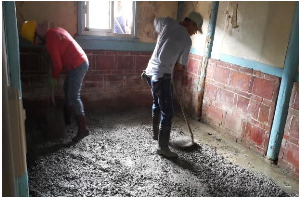
室內地面水泥灌漿及粉光