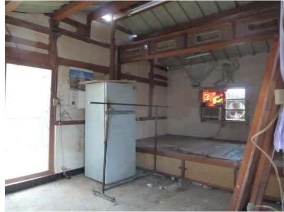
第一間房 (目前為起居室) - 床板破損