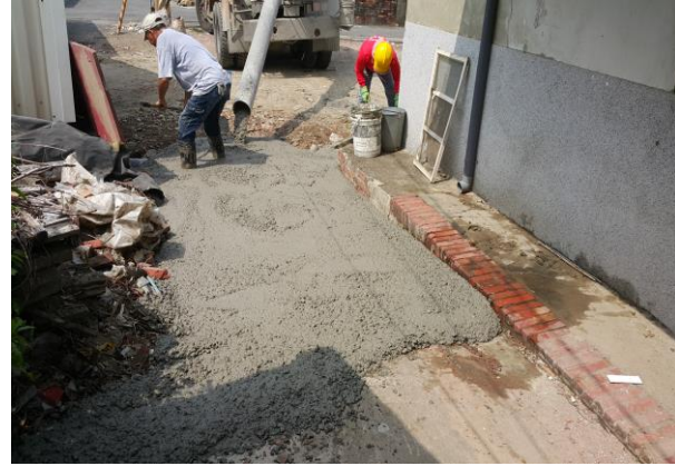
戶外地面灌漿及粉光