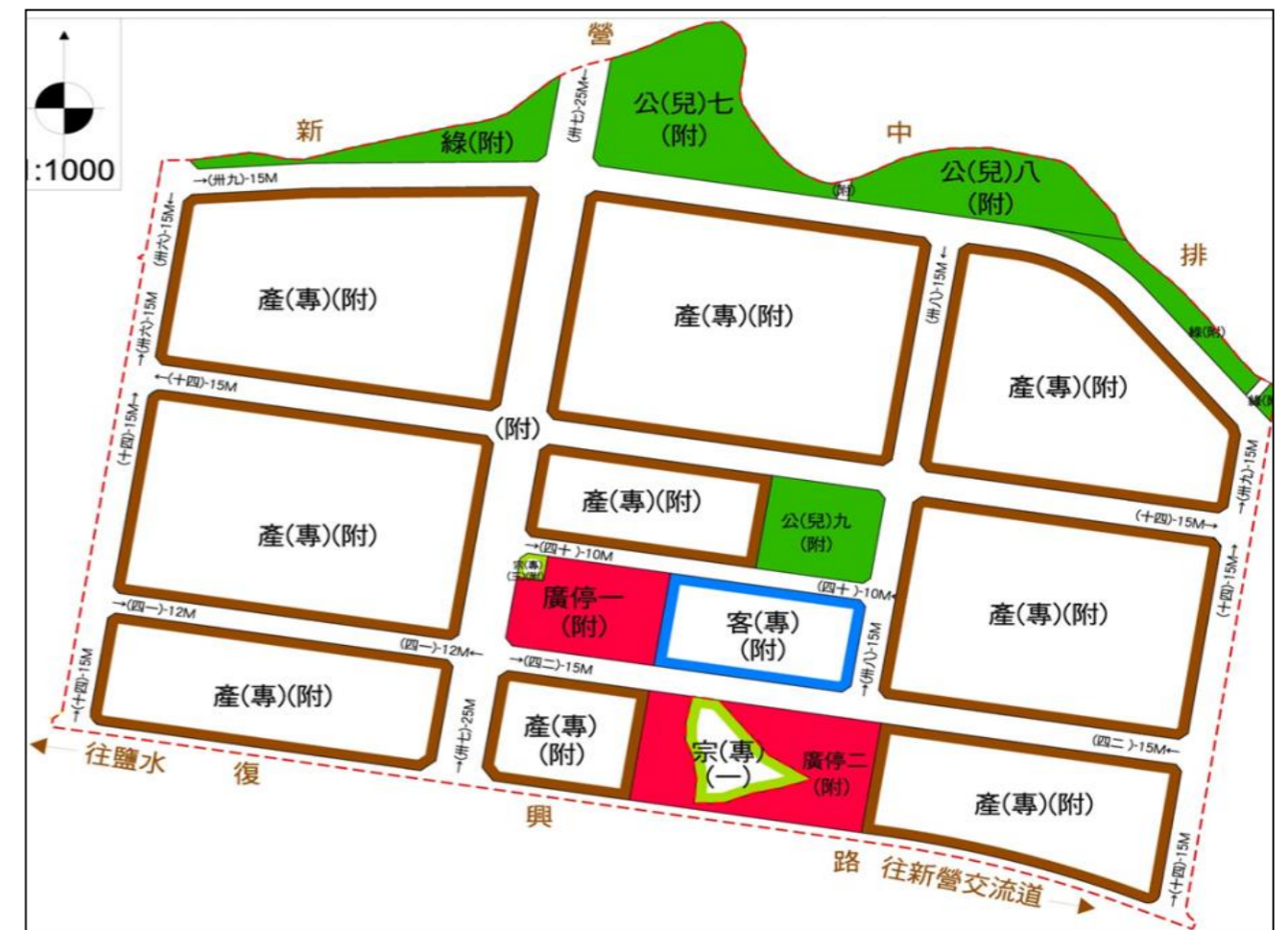
計畫位置與範圍示意圖