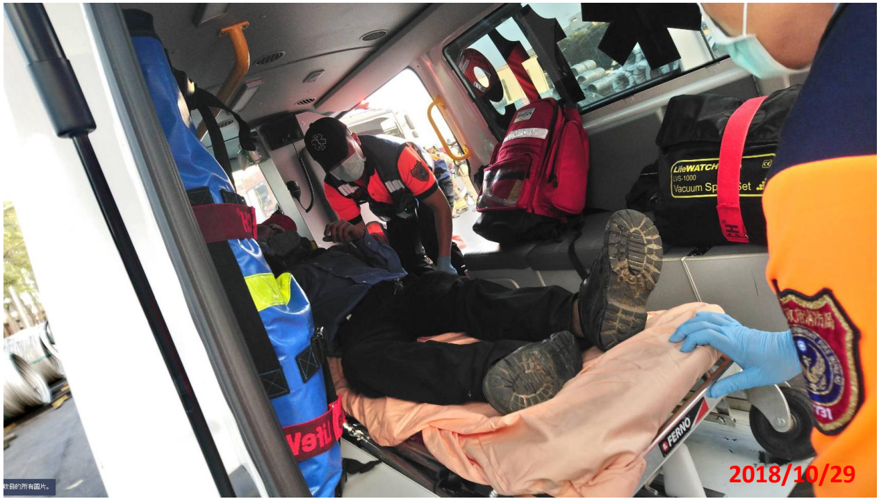
演練名稱：地震防災教育暨初期緊急避難及應變演練 演練項目：醫護車緊急將傷患送至鄰近醫院治療 地點：華新麗華股份有限公司(鹽水廠)