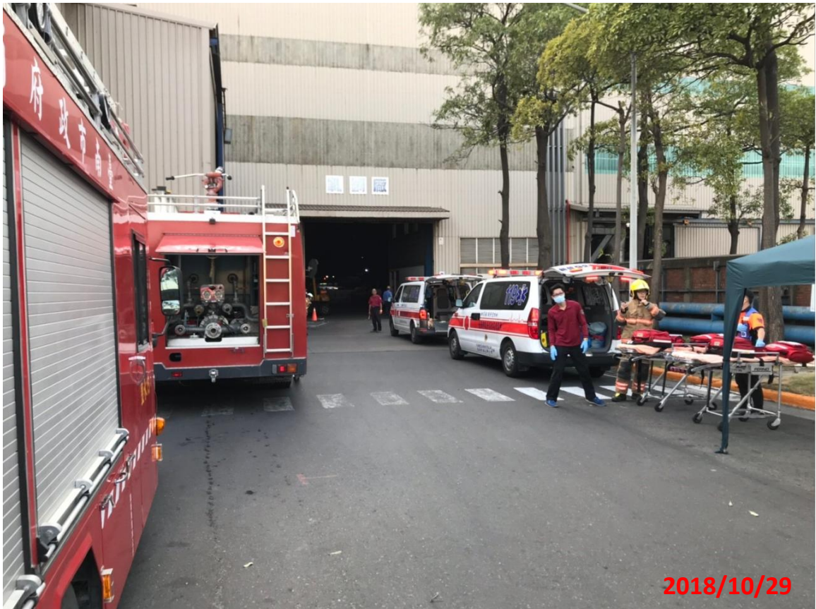
演練名稱：地震防災教育暨初期緊急避難及應變演練 演練項目：地震造成工廠發生大火消防車及醫護車進駐廠內搶救 地 點：華新麗華股份有限公司(鹽水廠)