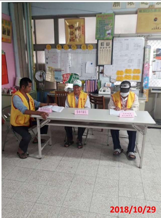
演練名稱：地震防災教育暨初期緊急避難及應變演練 演練項目：洪水里中長期避難收容所設置 地點：華新麗華股份有限公司(鹽水廠)