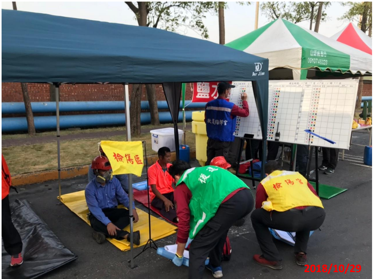
演練名稱：地震防災教育暨初期緊急避難及應變演練 演練項目：檢傷區進行傷患傷勢檢驗 地點：華新麗華股份有限公司(鹽水廠)