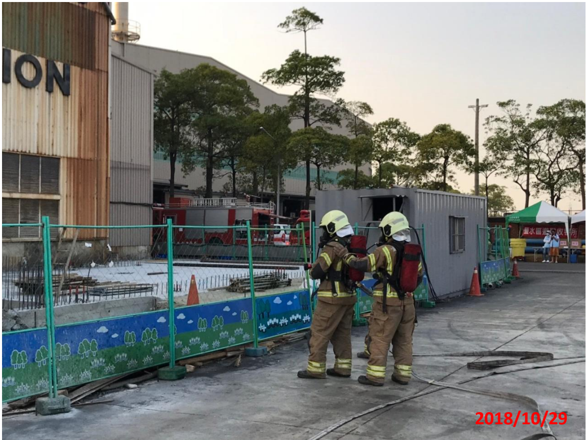
演練名稱：地震防災教育暨初期緊急避難及應變演練 演練項目：消防人員就定位進行滅火 地點：華新麗華股份有限公司(鹽水廠)