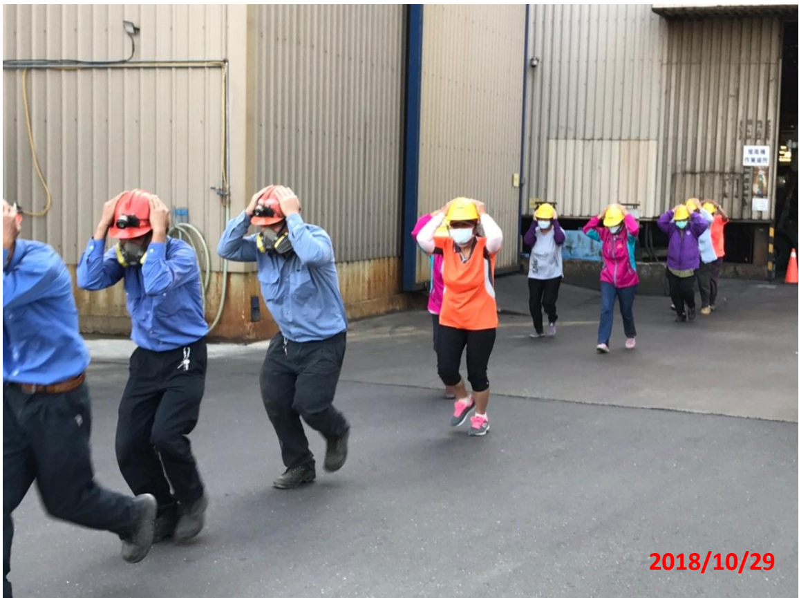
演練名稱：地震防災教育暨初期緊急避難及應變演練 演練項目：工廠人員緊急疏散撤離 地 點：華新麗華股份有限公司(鹽水廠)