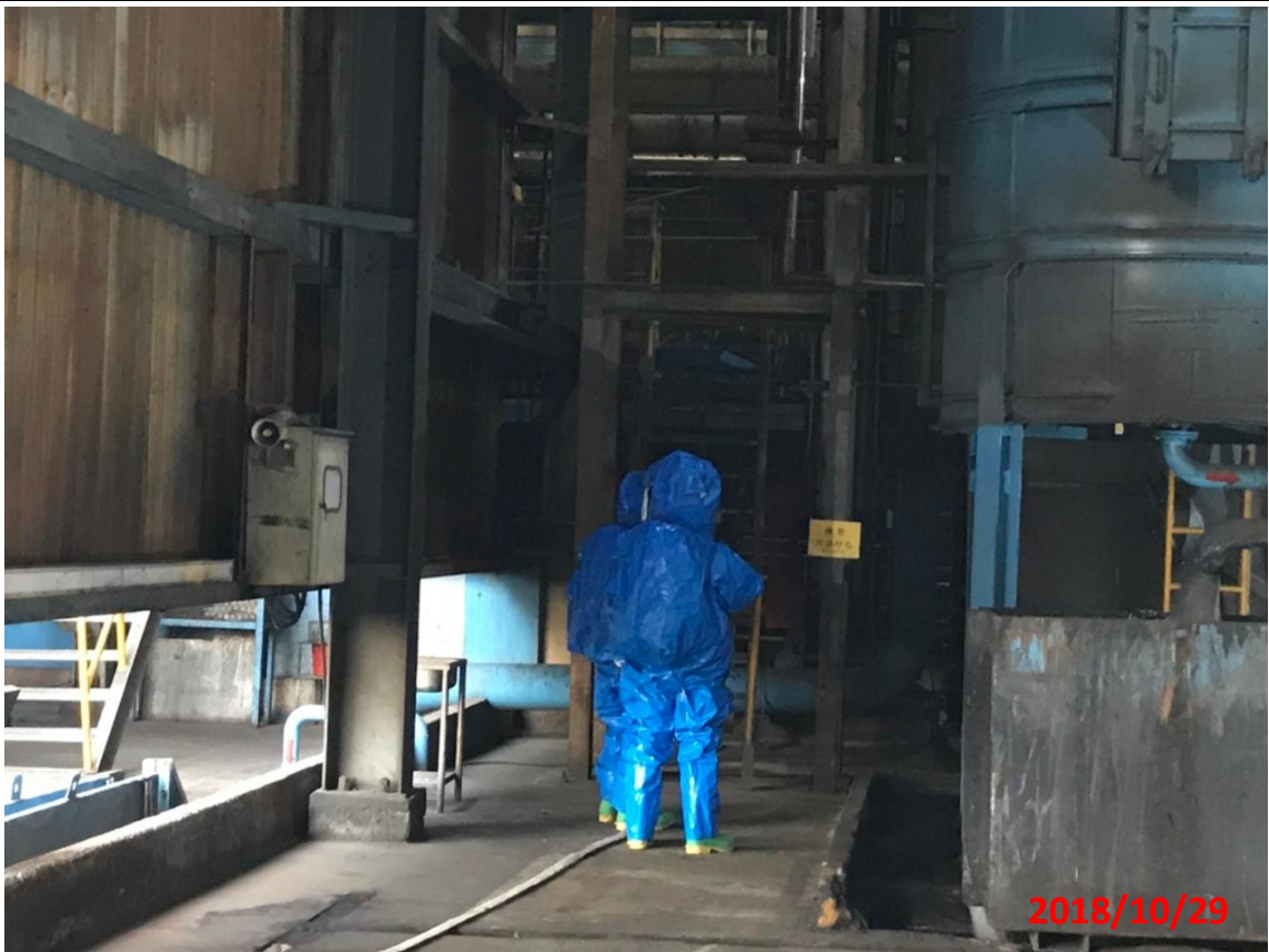
演練名稱：地震防災教育暨初期緊急避難及應變演練 演練項目：地震造成工廠製程特殊氣體外洩消防人員穿著 A 級防護衣進行搶救 地點：華新麗華股份有限公司(鹽水廠)