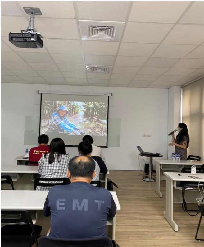
宣導社會多元性別觀念以促進性別平等