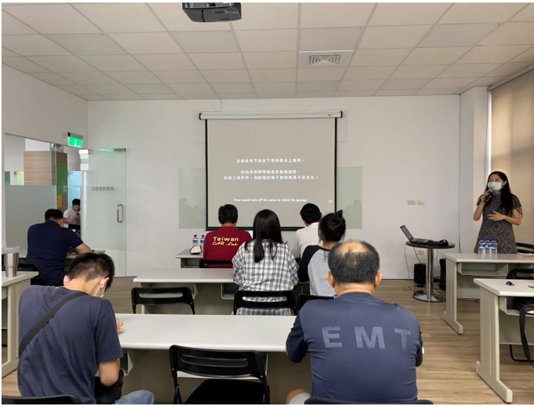
宣導社會多元性別觀念以促進性別平等