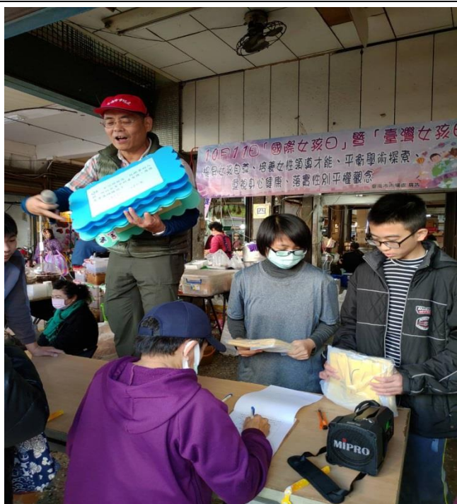
向民眾宣導提昇女孩自尊、培養女性領導才能、重視身心健康、落實性別平權觀念