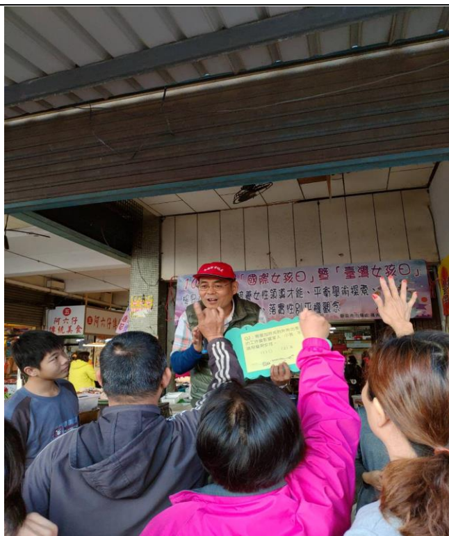
向民眾宣導提昇女孩自尊、培養女性領導才能、重視身心健康、落實性別平權觀念