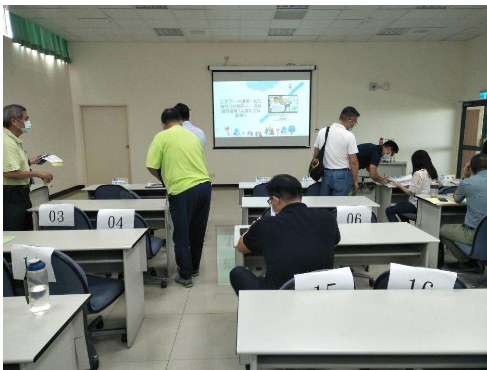
多元性別服務資訊輔導 2