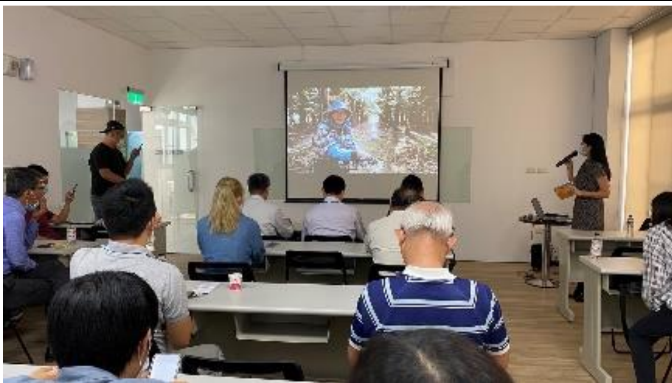
宣導社會多元性別觀念以促進性別平等