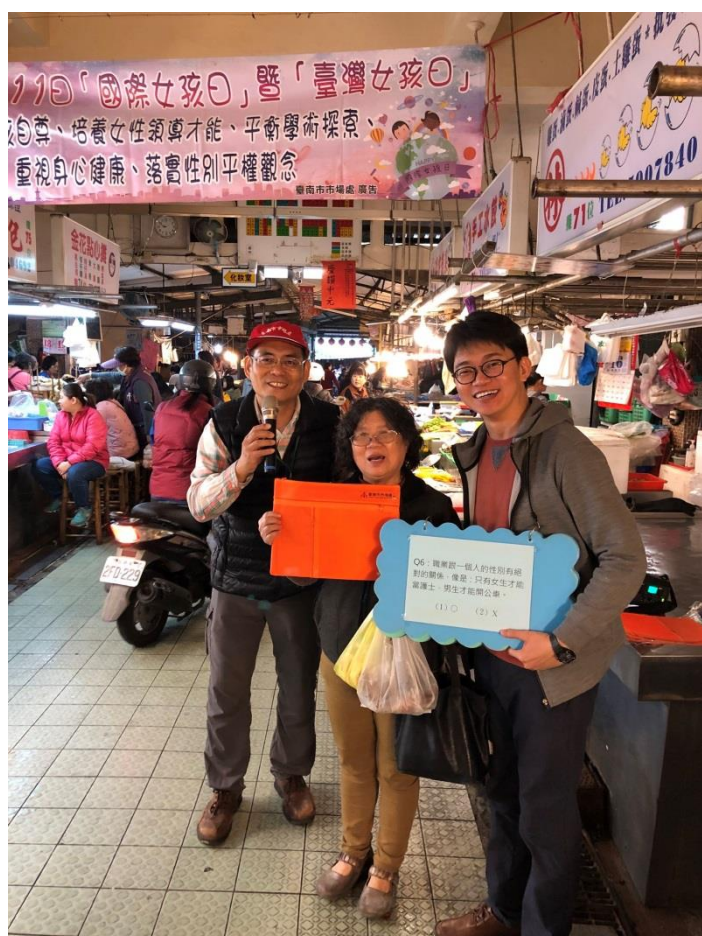
向民眾宣導提昇女孩自尊、培養女性領導才能、重視身心健康、落實性別平權觀念