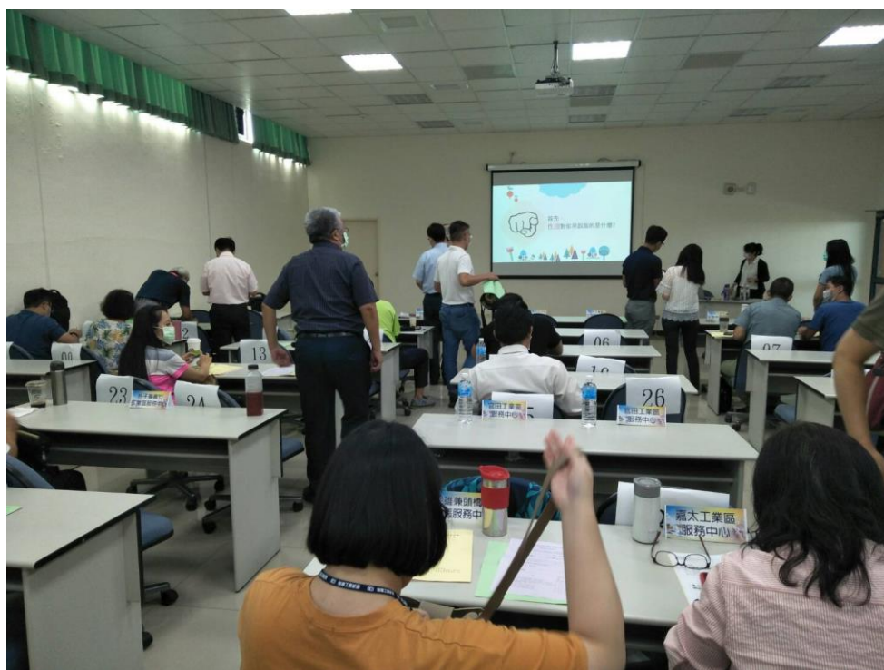
多元性別服務資訊輔導 1