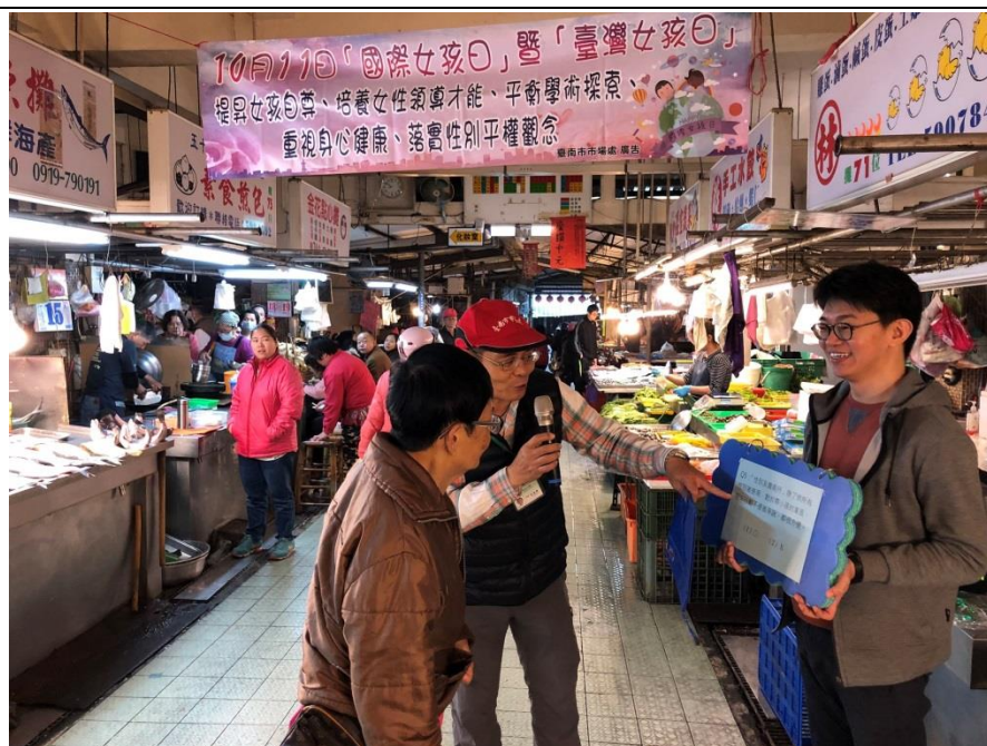
向民眾宣導提昇女孩自尊、培養女性領導才能、重視身心健康、落實性別平權觀念