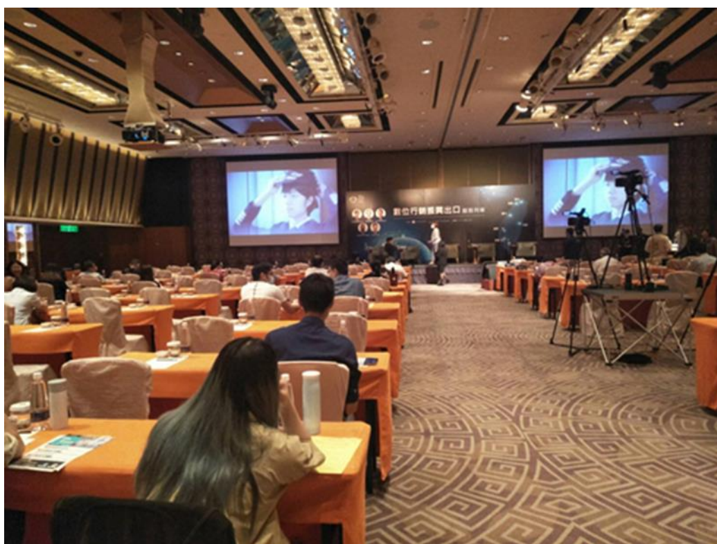
多元性別數位貿易輔導 2