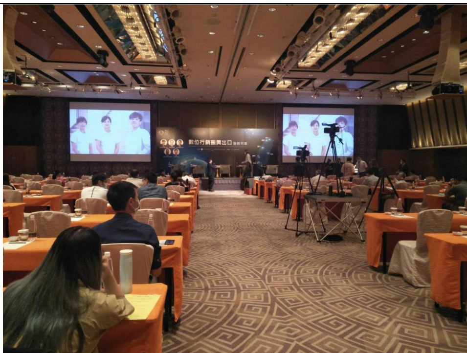
多元性別數位貿易輔導 1