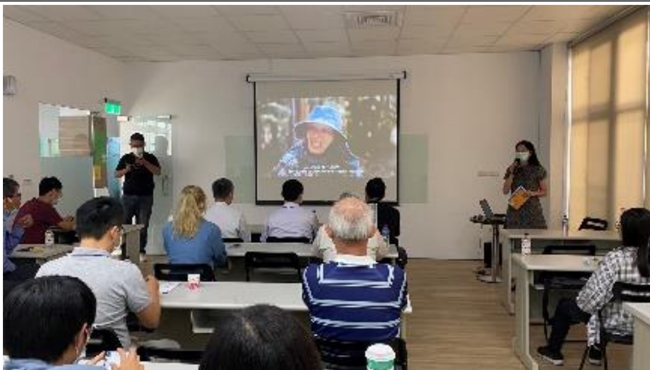
宣導社會多元性別觀念以促進性別平等