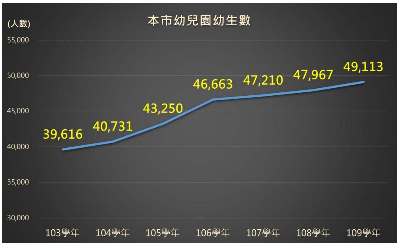
圖 3 本市幼兒園入園人數