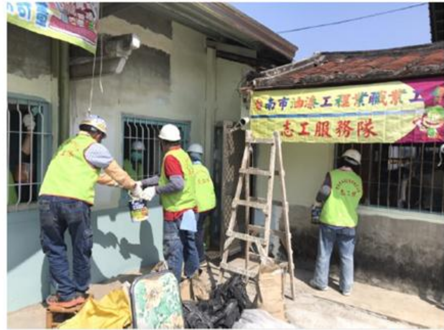
南市府結合各職業工會為弱勢修屋，口還贈送二手家具。（記者吳俊鋒翻攝）