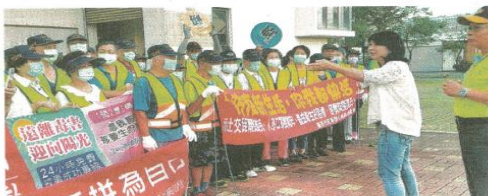
南市安南區公所安西里動員志工整理環境，市長夫人劉育菁(右二)出席為志工們加油打氣。

南市修繕志工團隊至今已完115戶，昨日除了新營區修繕服務，在屏東縣獅子鄉也有電氣工會志工同時為弱勢戶進行電燈、電線管路開關施工。