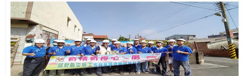
▲台南市政府勞工局「有情有疼心入厝」做工行善團，(今)11月22日不工、油漆工會志工分二路各自前往柳營區與將軍區為弱勢家庭修屋。