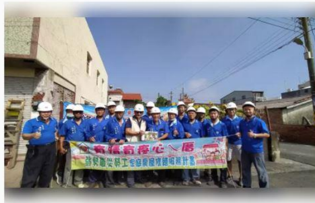
關懷弱勢者，台南市政府勞工局動員修繕志工協助修屋。

台南市政府勞工局今動員木工、油漆工會修繕志工，前往柳營、將軍區進行修屋，希望透過更多修繕志工投入，展現市府勞工局「有情有疼心入厝」照顧弱勢者精神。