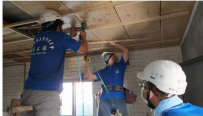
木工工會志工前往柳營區，為弱勢家庭房屋修繕。