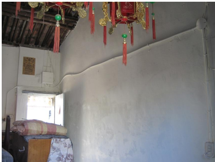
油漆完成整潔的客廳