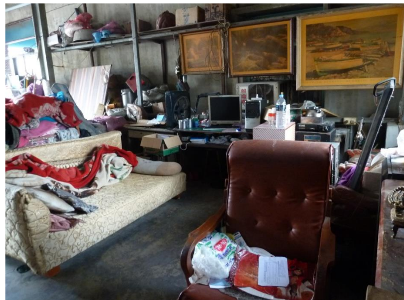
案父居住之鐵皮屋