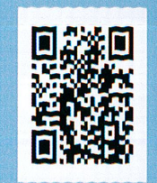
食品業者登錄平台

https://www.fda.gov.tw FDA 食品藥物管理署 Food and Drug Administration