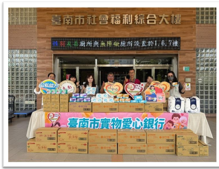
114年康那香企業股份有限公司用實際行動響應臺南市政府性別平等政策及照顧弱勢理念，捐贈衛生棉予臺南市社會局服務中之弱勢家戶