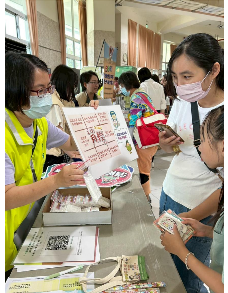
活動設攤向民眾宣導