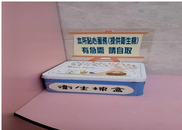
公廁放置生理用品提供民眾使用