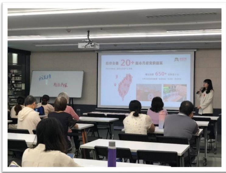
112年本府性別平等辦公室邀請全球小紅帽協會辦理專題講座