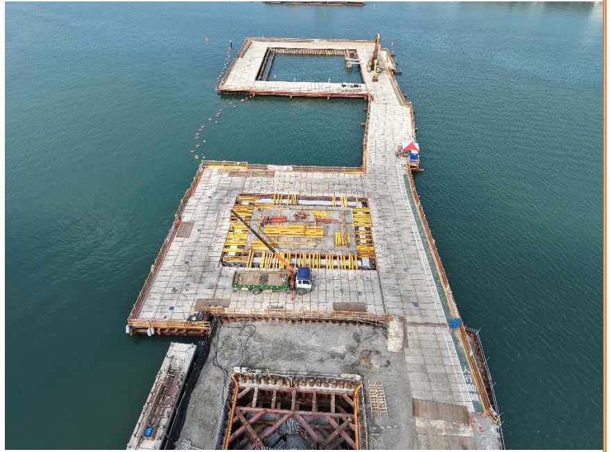
P6 橋墩海上構台施作

(第 23 次份)職安協 議組織會議、第 49、 50 次安衛環保暨施 工進度協調會、場撐 段第一單元施工前 教育訓練