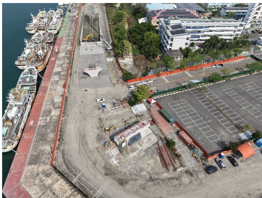
P1 及 P2 橋墩

(九) 工區噪音監測、放流水監測、海上浮球燈吊放、工區土方小搬運及物料整理、生態補償計畫執行方針會議、115 年 03 月