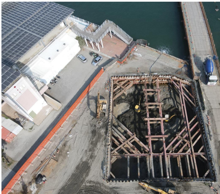
P3 橋墩基礎開挖及擋土支撐施作