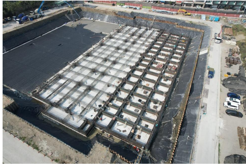
工地位置：安平區育平路與建平八街交叉口