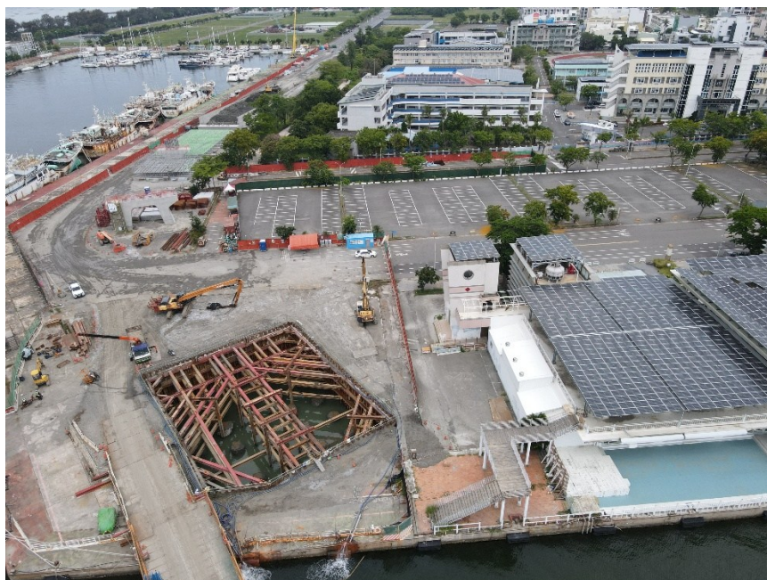
P3 橋墩擋土支撐施作