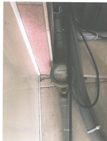
自來水錶近照，需加註水源地址 (水源地址：○區○路○號)