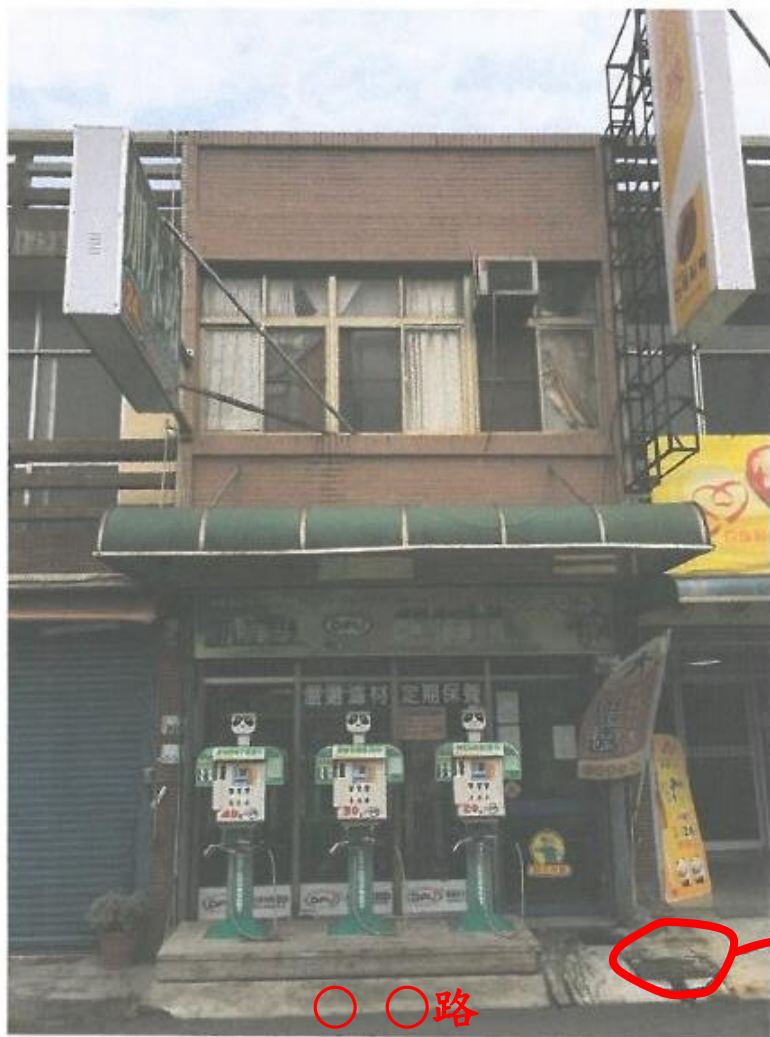
○ ○路 (加水機面向的路名)