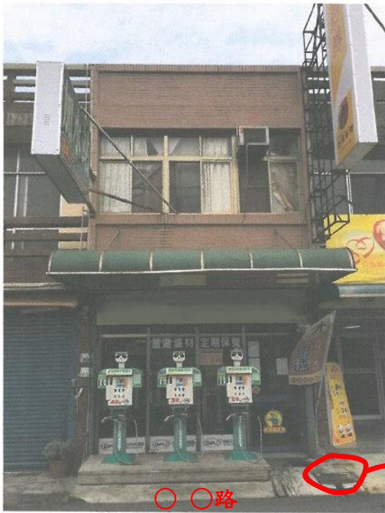
○ ○路 (加水機面向的路名)