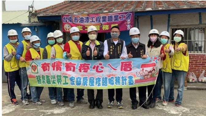
台南做工行善團今日前往台南、高雄修繕弱勢屋，結合當地資源推動，鹽水9旬老翁獨居戶粉刷後完工，安心過好年，志工也很欣慰。