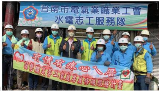
勞工局做工行善團電氣志工至玉井區為江姓屋主火災屋配置電線管路。