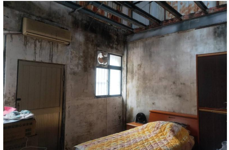
案家房間老舊漏水