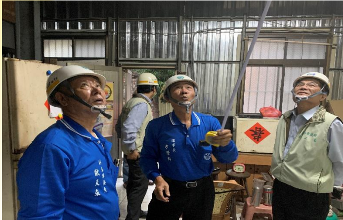
案家客廳天花板嚴重漏水