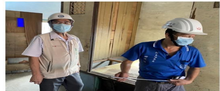
南市「做工行善團」犧牲假期，兵分5路做「繕」事！

市長黃偉哲特別感謝勞工局「做工行善團」志工長期不惜犧牲自己的假期為弱勢朋友修繕房屋，樂在公益奉獻之餘，更為社會立下良好的模範，行善不一定要捐款，貢獻己身專長也能奉獻公益，志工團隊用最實際的行動讓台南市成為溫暖的「希望家園」，而透過這樣民間與政府共同合作的力量，定能幫助更多職災勞工與弱勢族群。