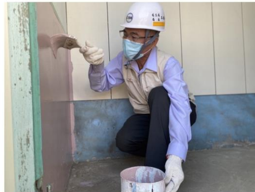
▲勞工局長王鑫基假日不休假依然到鹽水親自幫忙身障勞工修繕房屋及油漆

居住於鹽水區的趙姓案主從小與爸爸相依為命，不料爸爸在他高一時期因身體狀況不佳無法工作，高職畢業後，透過勞工局身心障礙職業重建窗口提供支持性就業服務，媒合成功企業辦公室環境清潔人員，穩定就業後，勞工局身障職重個管員在後續關懷時，發現案主家中無衛浴設備供洗澡且房屋破損不堪，居住品質極差，遂由台南做工行善團隊進行會勘及修繕。