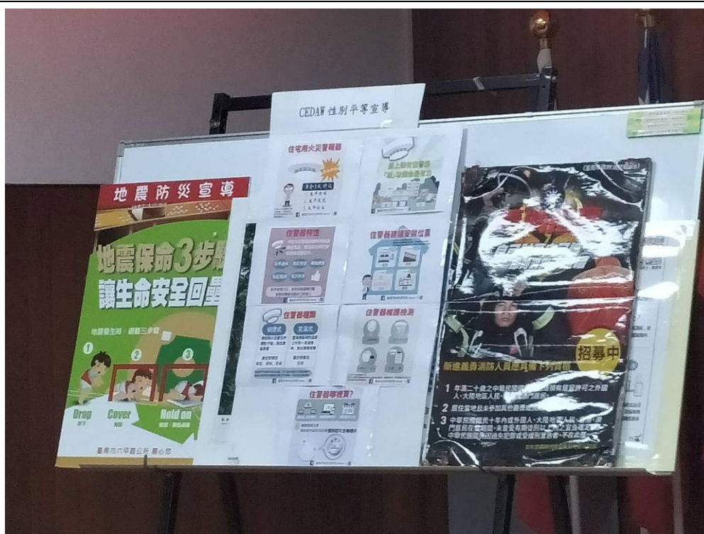
宣導單上介紹何謂 CEDAW 以及住警器