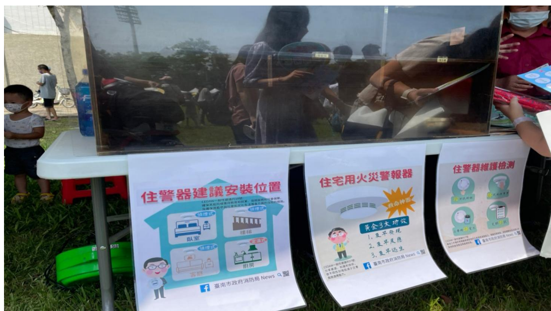
照片說明:2022 年親子嘉年華會 CEDAW 宣導。