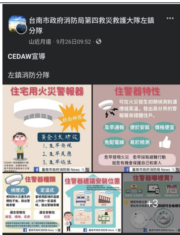
照片說明:左鎮分隊官網 FB CEDAW 宣導