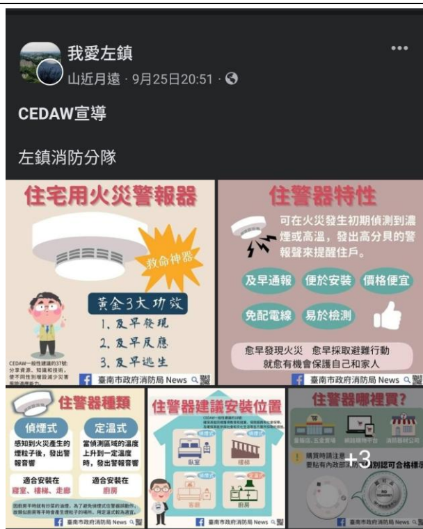
照片說明:我愛左鎮 FB 社群 CEDAW 宣導