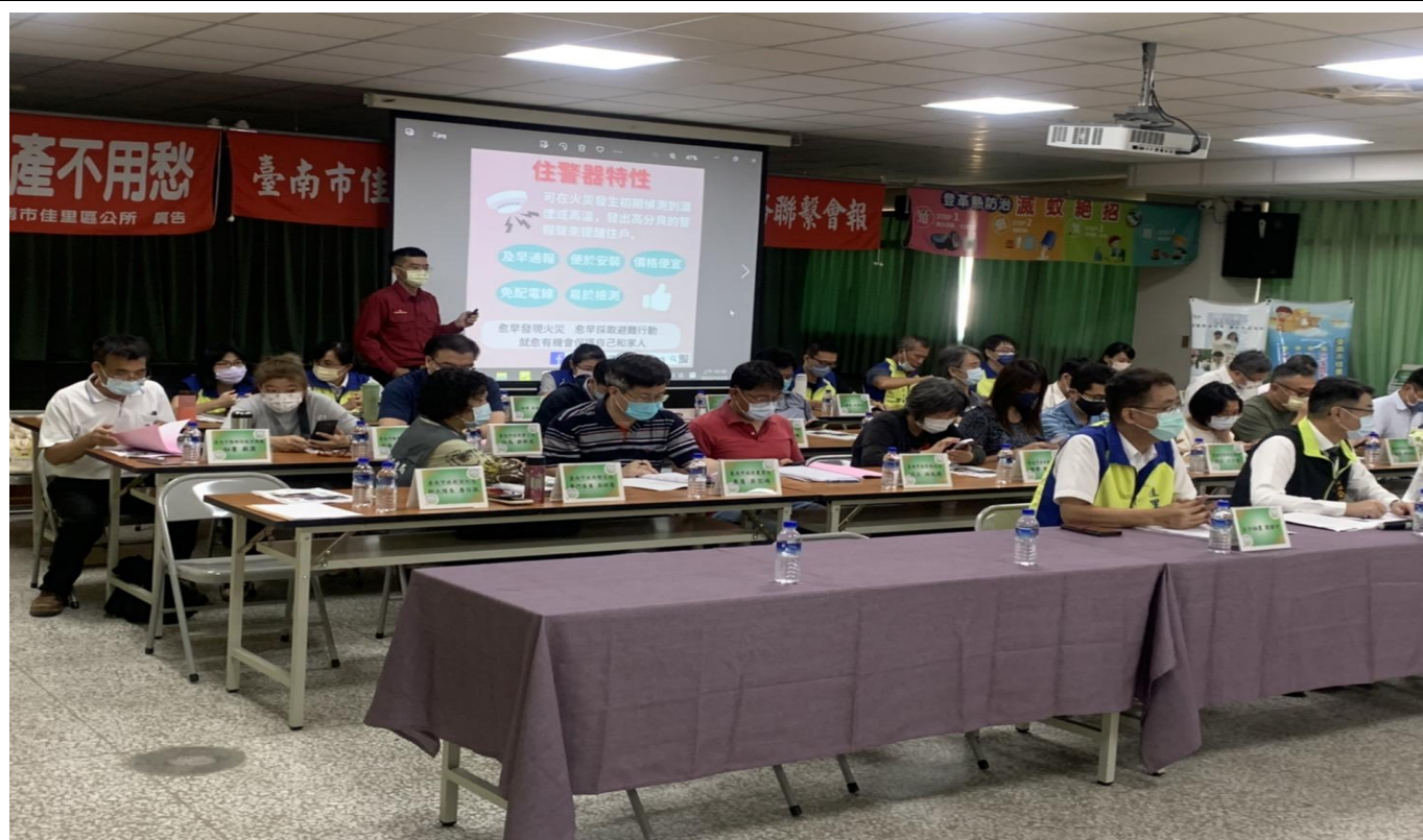
照片說明：住警器介紹