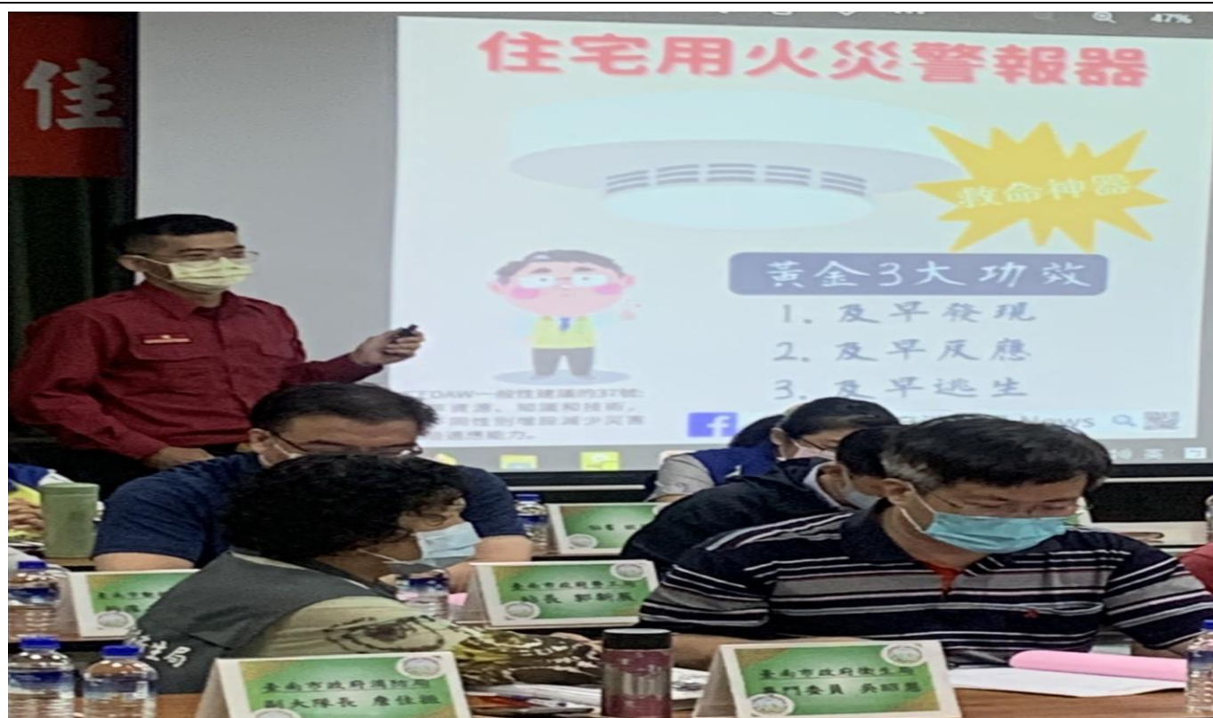
照片說明：CEDAW 法條宣導