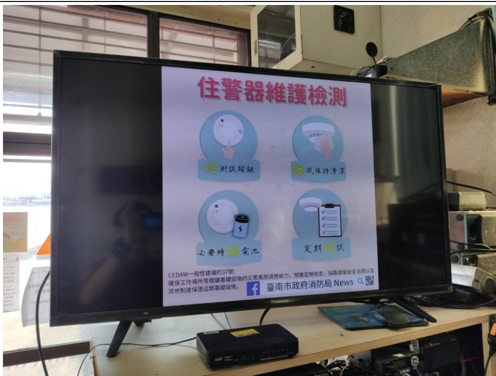
照片說明(影片播放宣導)