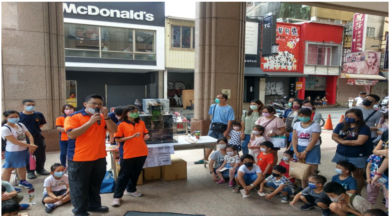
照片說明:至新光三越辦理 CEDAW 宣導