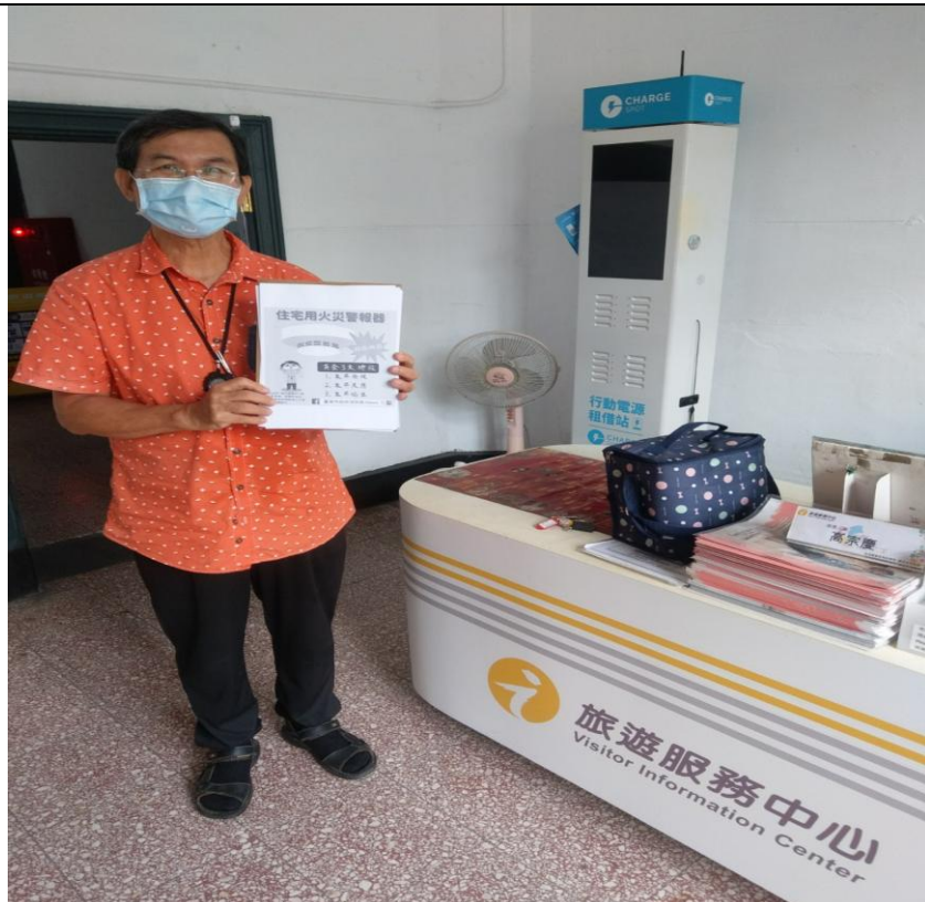
照片說明:向旅遊服務處志工宣導，使知悉女性在职場上重要性。