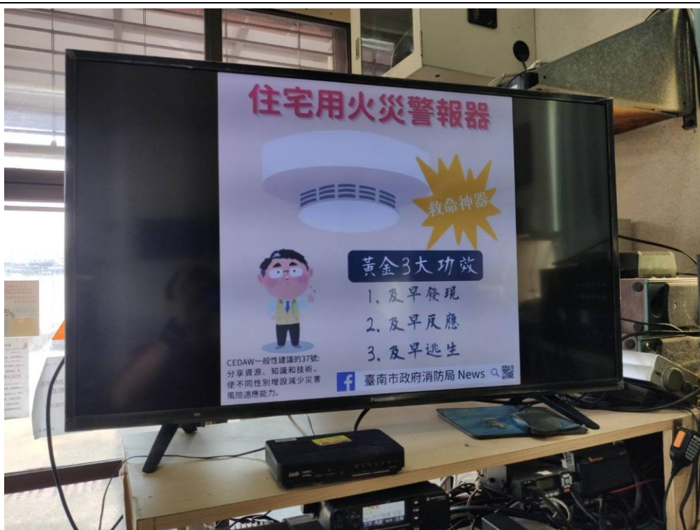
照片說明(影片播放宣導)