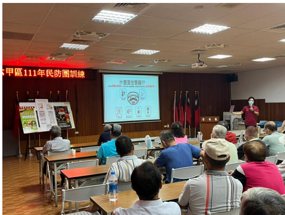
住警器介紹與 CEDAW 法條宣導