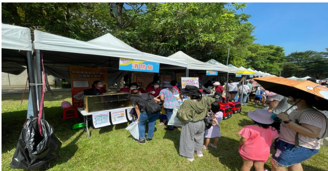
照片說明:2022 年親子嘉年華會 CEDAW 宣導。