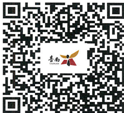
111年度第3批臺南市市有耕地及養殖用地放租土地位置QRcode