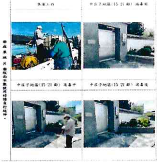
紅甲里辦公處高壓噴霧機修理(2)