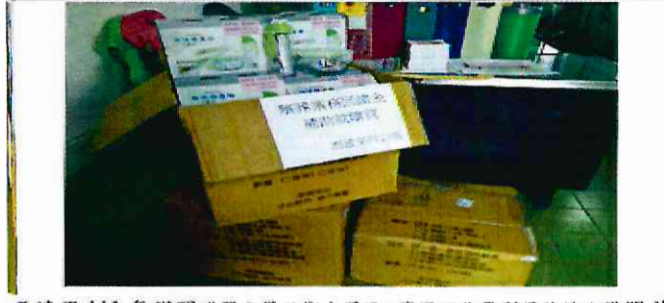
西連里 111 年辦理購買宣導品衛生環境、資源回收再利用法治宣導照片