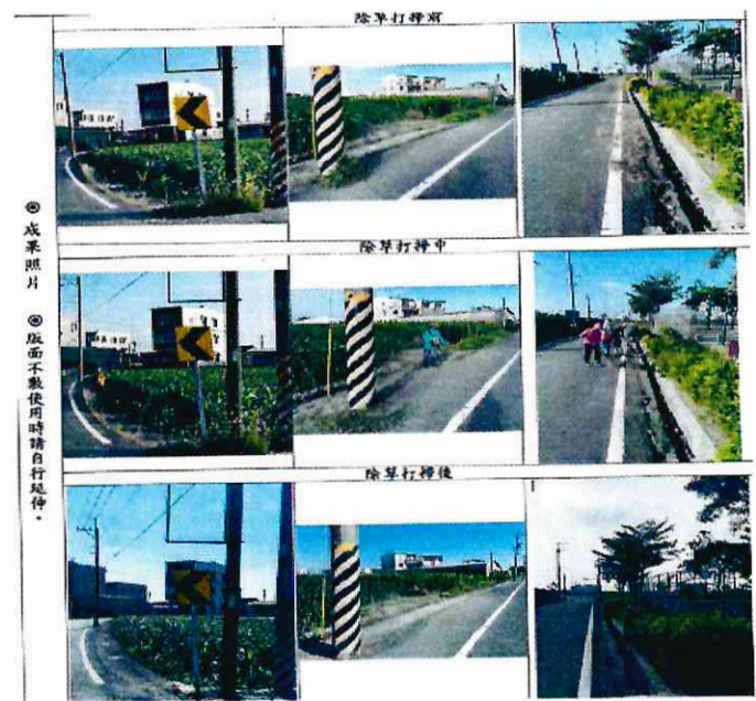
大吉里辦公處僱工除草(11)