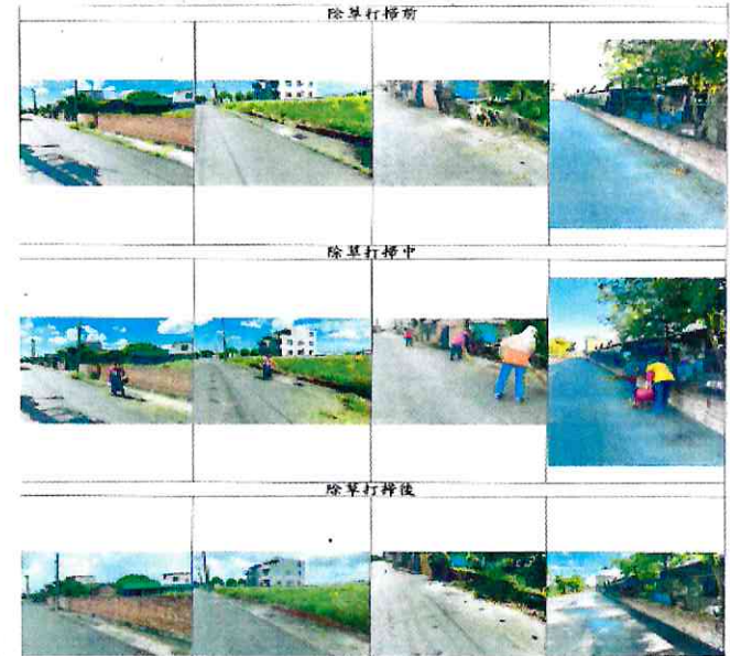
大吉里辦公處環境整頓僱工除草打掃費用(3)