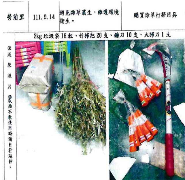
營前里辦公處購買除草打掃用具