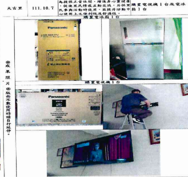
大吉里辦公處購置電視機及電冰箱(8)