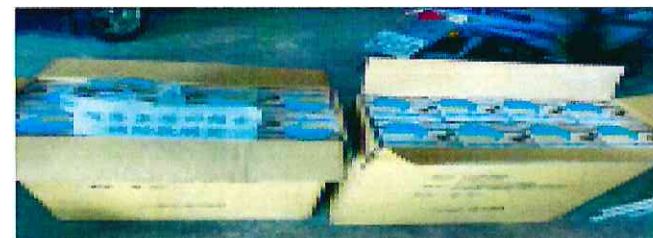
宅內里辦公處購置宣導環保餐盒