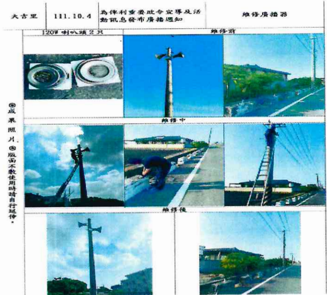
大吉里辦公處廣播器維修(10)