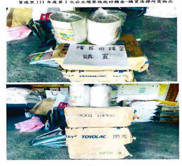
賀建里辦公處購置清掃用品