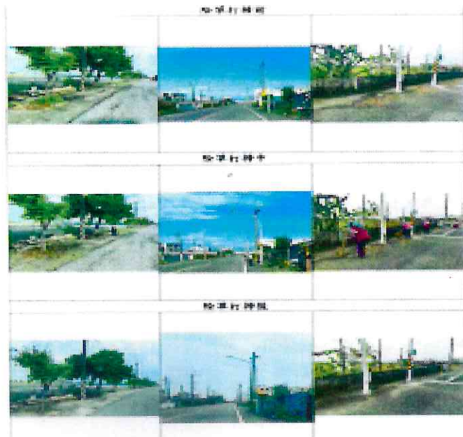
大吉里辦公處環境整頓僱工除草打掃費用(1)