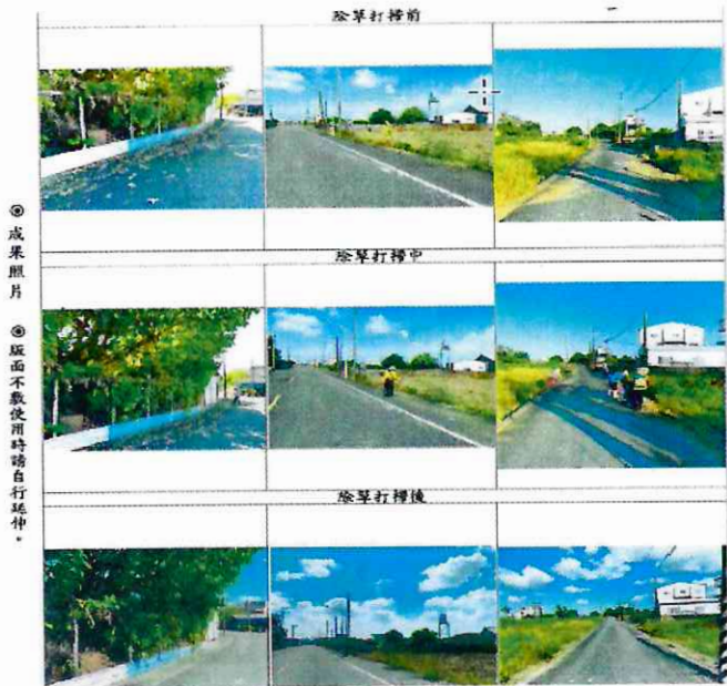
大吉里辦公處環境整頓僱工除草打掃費用(6)