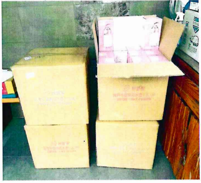
茅營里辦公室購置背帶手提兩用水壺