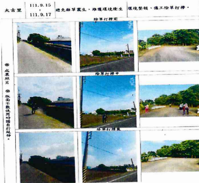
大吉里辦公處環境整頓僱工除草打掃費用(7)