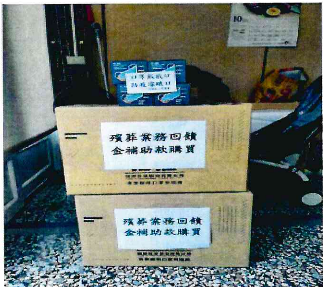
後街里辦公處購置宣導品口罩