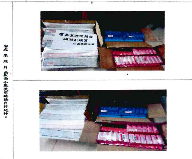
仁里里辦公處購置宣導品毛巾及香皂