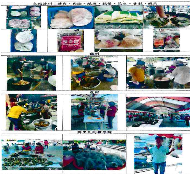
大吉里辦公處辦理端午節粽葉飄香活動(4)