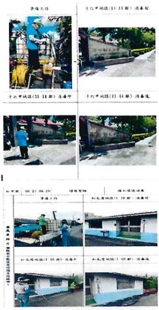
紅甲里辦公處環境整頓僱工消毒(1)