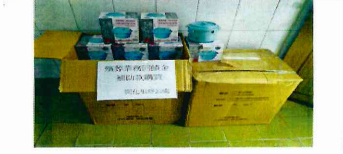
開化里辦公室購置宣導品造型便當盒