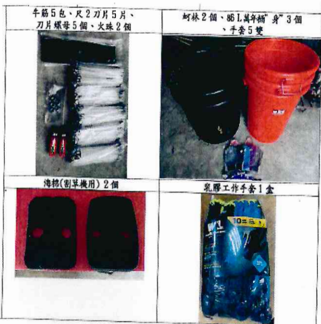
大吉里辦公處環境僱工打掃用品(11)