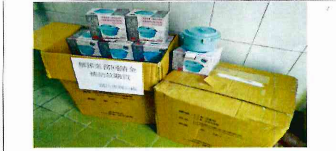
開化里 111 年辦理購買宣導品衛生環境、資源回收再利用法治宣導照片