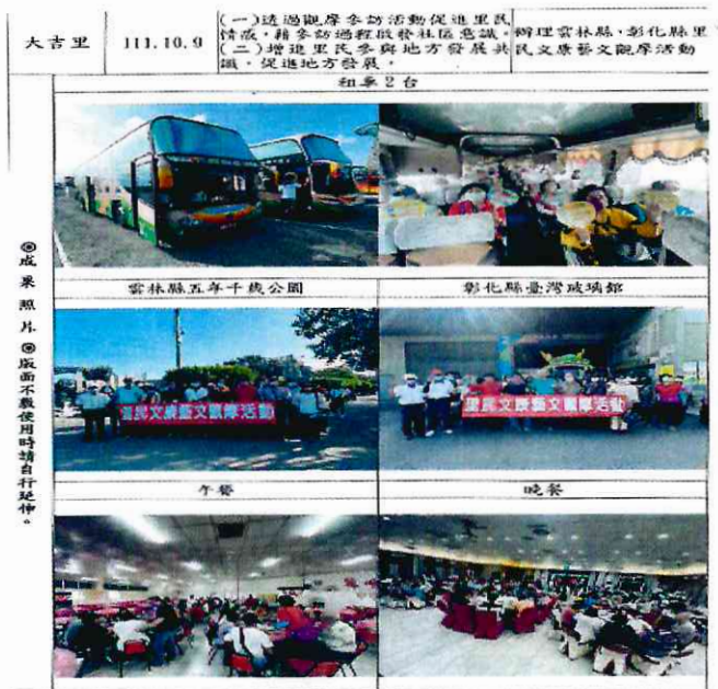
大吉里辦公處辦理文康藝文觀摩活動(9)