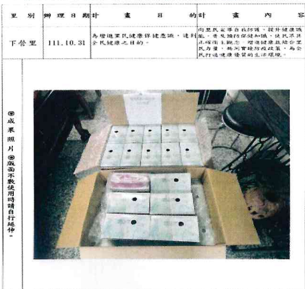
下營里辦公處購買宣導口罩