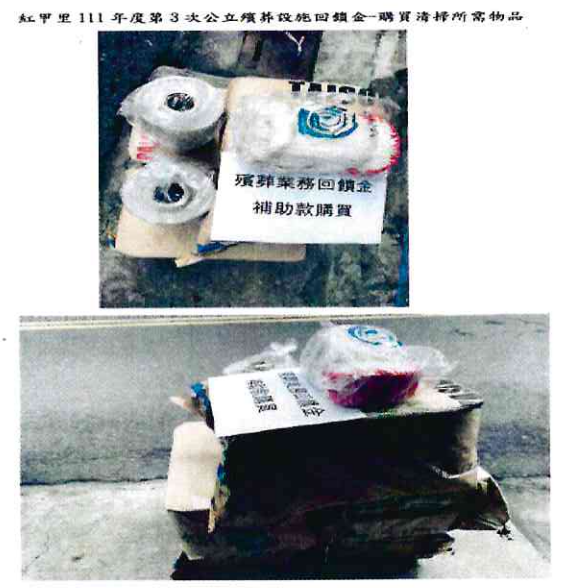
紅甲里111年度第3次公立殯葬設施回饋金-購買清掃所需物品