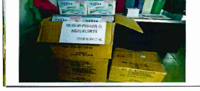
西連里辦公室購置宣導品玻璃禮盒組