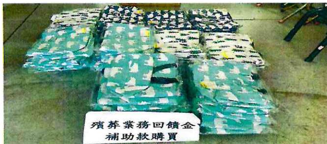
新興里辦公處購置宣導品環保袋