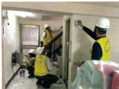
年後開工，勞工局結合做工行善團馬不停蹄查勘，志工們陸續進行房屋修繕工作。