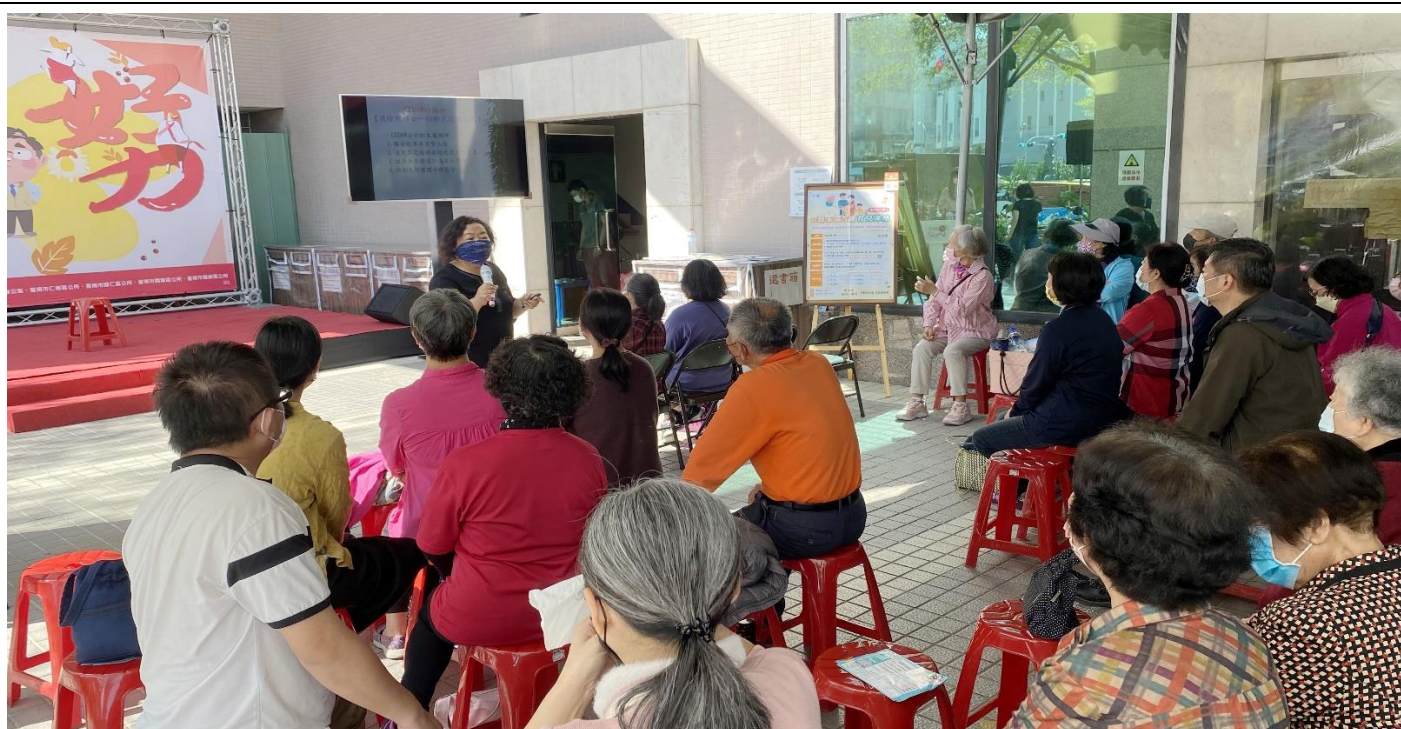
臺南市政府民政局、性別平等辦公室，以及聯合永康、仁德、歸仁、關廟、龍崎等公所，特舉辦 2022「女力好力」活動