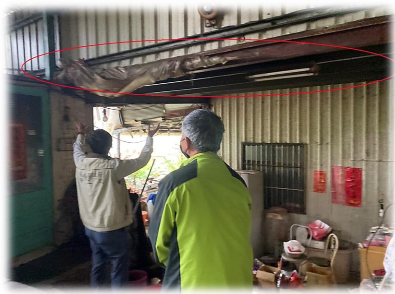
鐵皮屋頂漏水處修復後