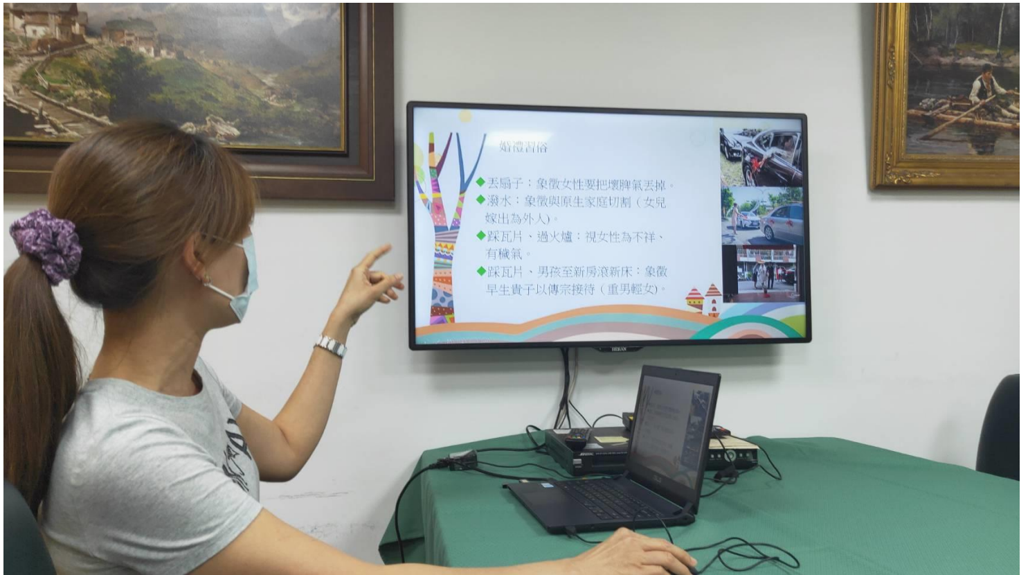
主講人以自製簡報分享傳統習俗中的性別議題