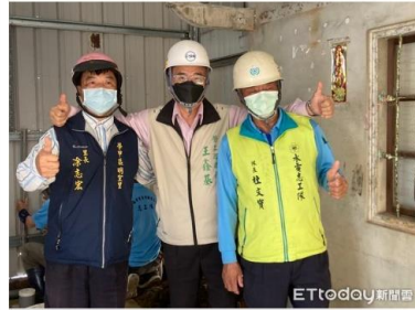
▲台南市勞工局成立的「做工行善團」不停歇的為安南區、善化區、學甲區及白河區進行房屋修繕作業。(圖/記者林悅翻攝，下同)