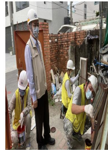
▲台南市勞工局員工連假也不休息，前往勞工善團工地點驗修繕工具。

臺南市勞工局做工行善團「禮」不分動假日，在屬於自己的日子「五一勞動節」，盡確實力為弱勢族群修屋。