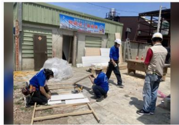
▲台南市政府勞工局成立的「做工行善團」，一步一印修繕弱勢工學及弱勢族群修屋