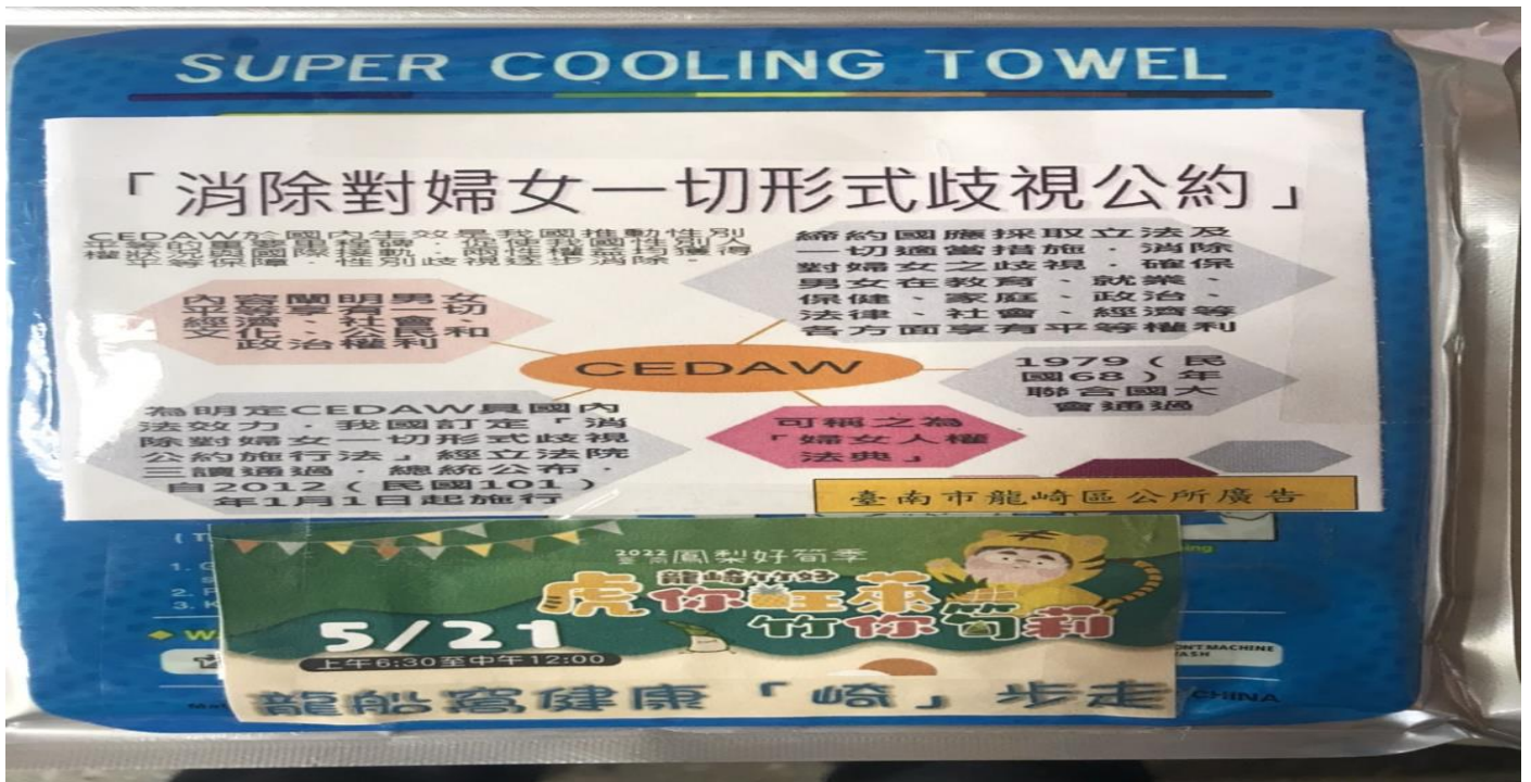
贈品加上自製 CEDAW 廣告文宣