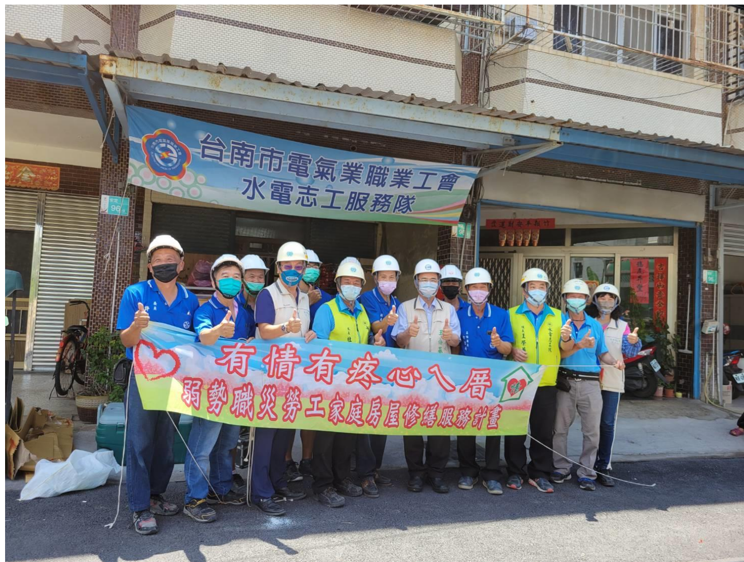
台南市木工業職業工會