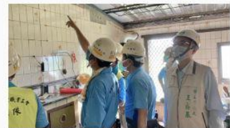
南市「做工行善團」今日分三路修繕低收入弱勢家庭房屋。

安定區中低收入戶的陳姓屋主，85歲，新近因磁磚屋，中低收入和喪失生活自理能力，83歲妻子多年臥床無法行走，亦無生活自理能力，夫妻生活困難全靠大女兒照料，陳姓屋主因磁磚屋、磁磚屋也多處磁磚屋，本月20日先由木工及泥水工新修磁磚屋的磁磚屋，今由泥水工及泥水工進行磁磚屋內磁磚屋、磁磚、磁磚、油漆磁磚屋等工程，期望改善家家生活品質。