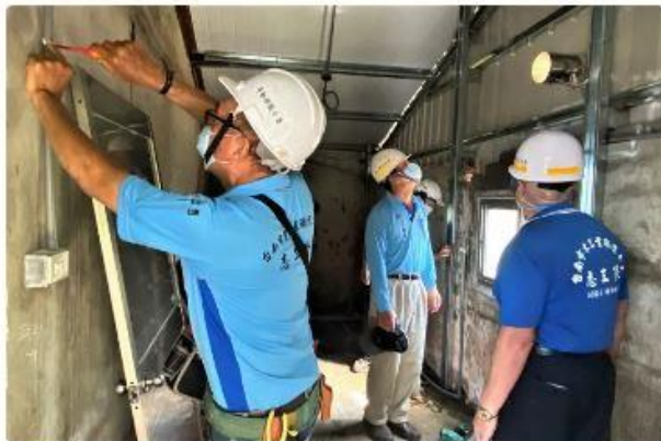
做工行「做工行善團」志工不憚炎暑，持續為低收入弱勢家庭修繕房屋。