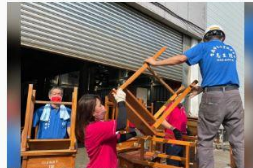
南市「做工行善團」今日分三路修繕低收入弱勢家庭房屋。

南市「做工行善團」木工及泥水志工今日分三路前往關廟、柳營、安定區低收入弱勢家庭修繕房屋；木工志工更分期與台南市勞工服務協會志工前往台南區裁縫企業創二代家日專科社合辦修繕家日，以期修繕後家日給有弱勢弱勢家庭使用。