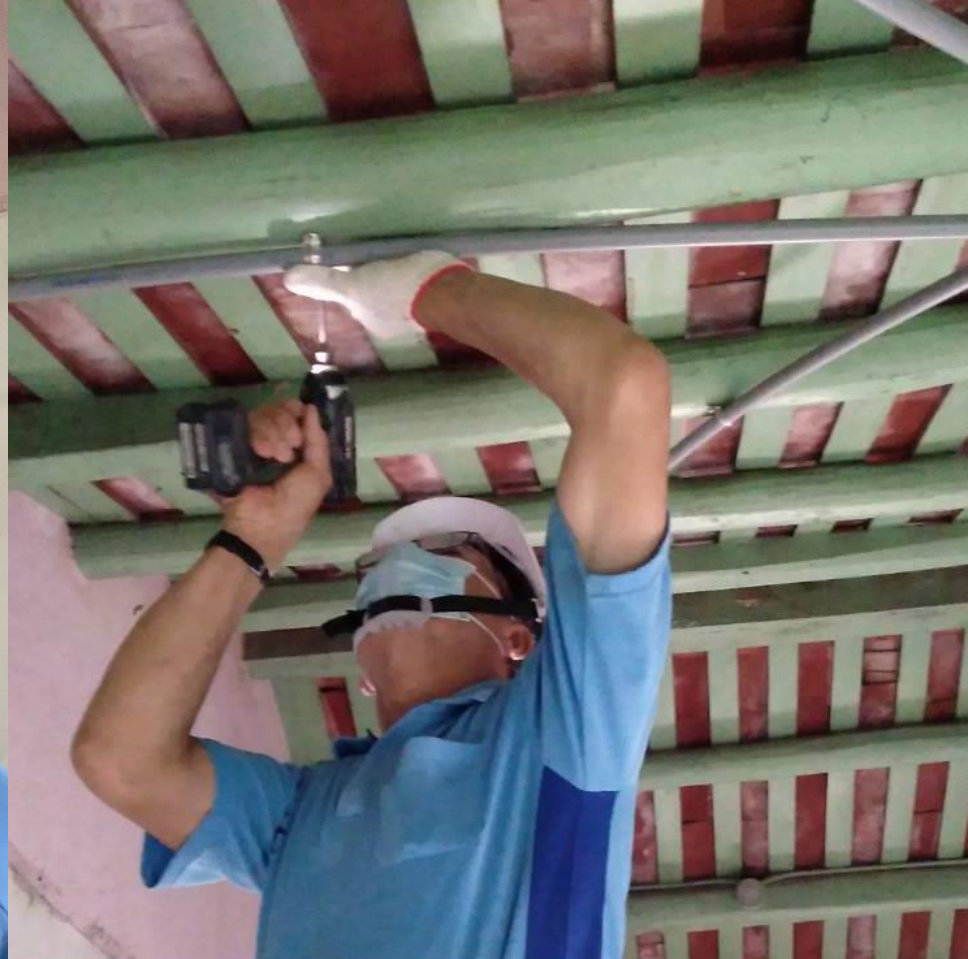
修繕施工 III.6.5 客廳、臥室電線配置施工