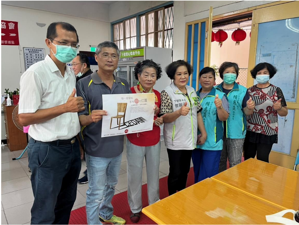
透過文宣向民眾宣導