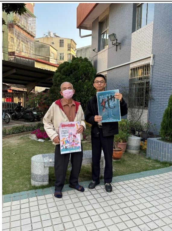
講解性別平等觀念