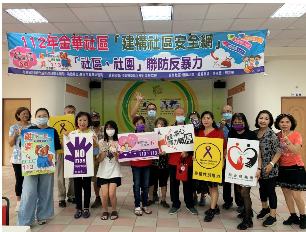
活動文宣手舉牌合影