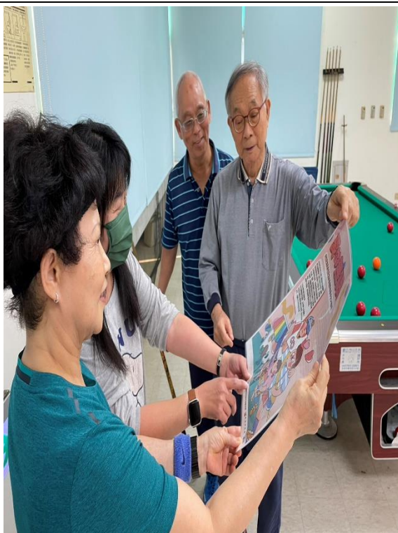
講解性別平等觀念