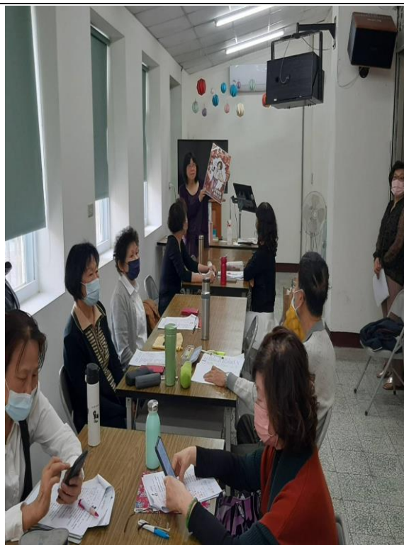
講解性別平等觀念