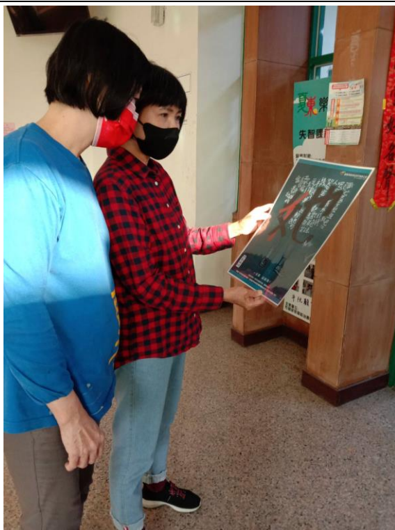
講解性別平等觀念