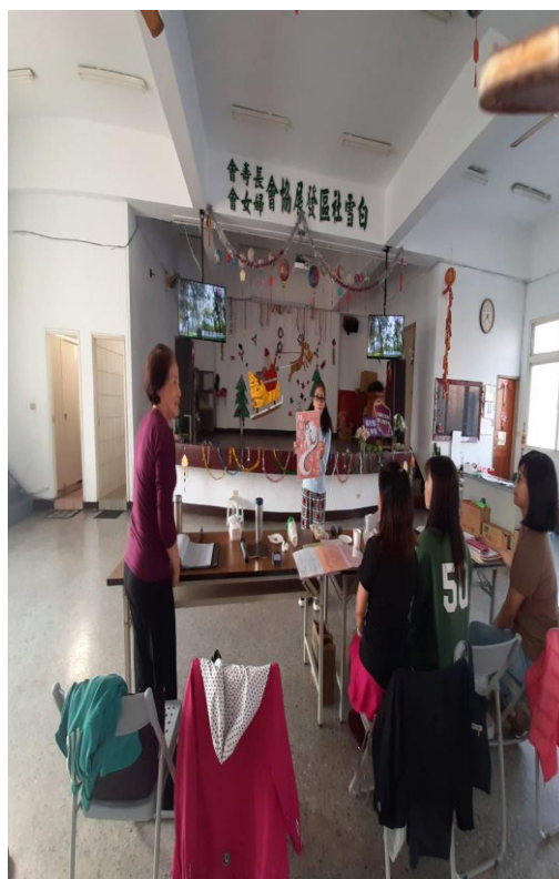
講解性別平等觀念