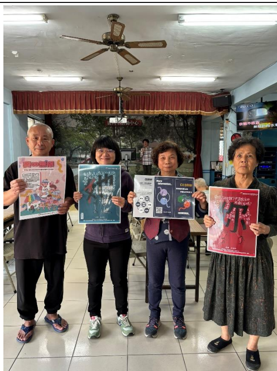
講解性別平等觀念