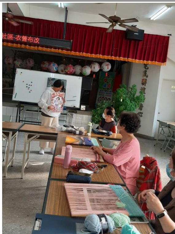
講解性別平等觀念