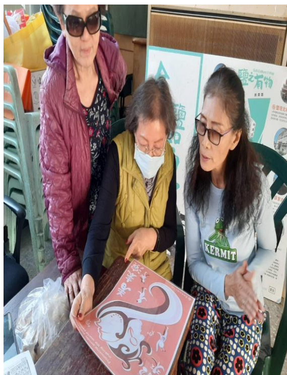
講解性別平等觀念