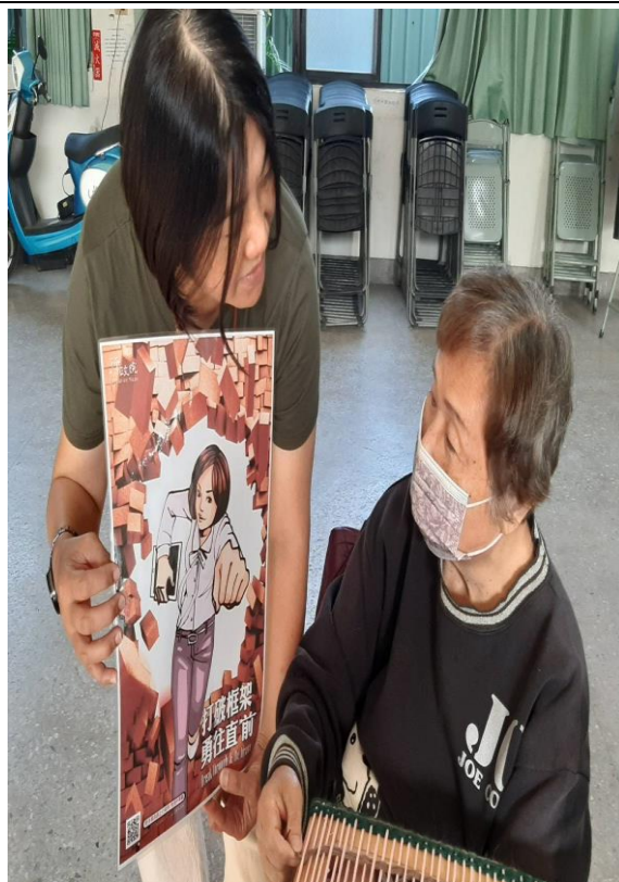
講解性別平等觀念