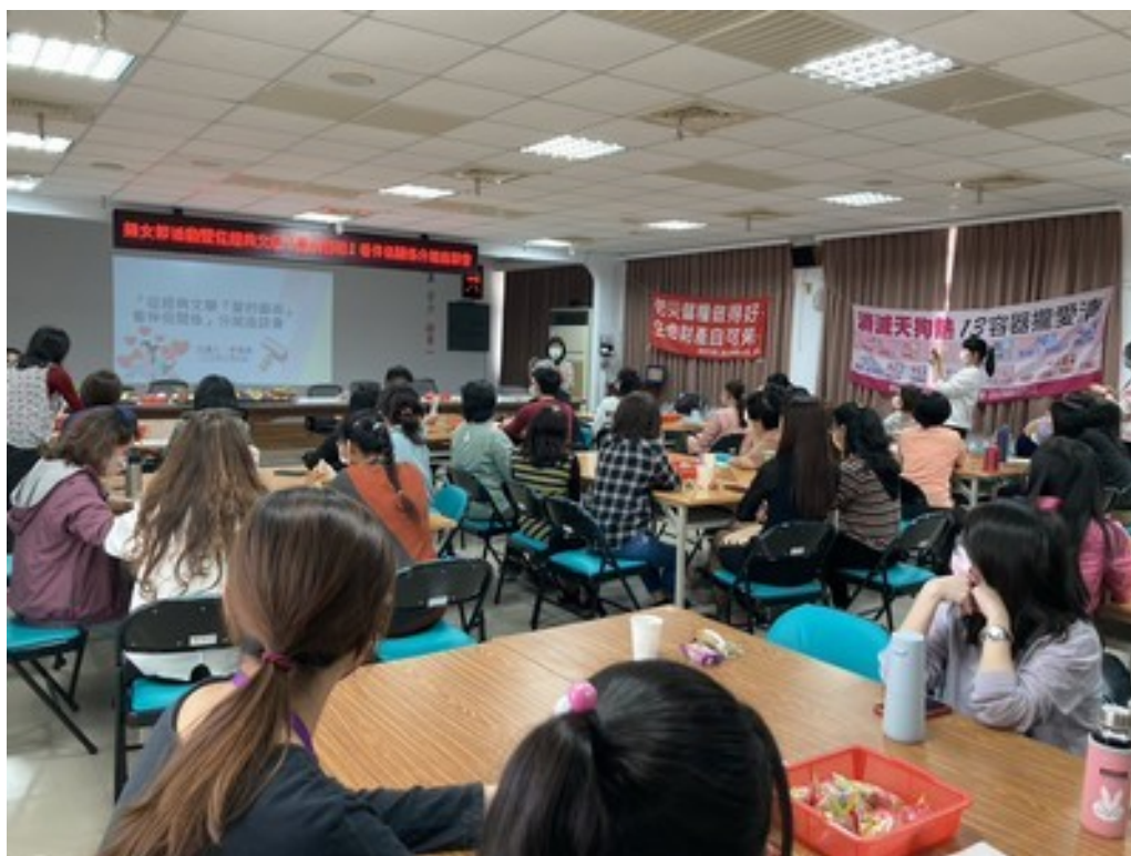
講師說明性別專長領域與授課大綱及分組座談進行方式