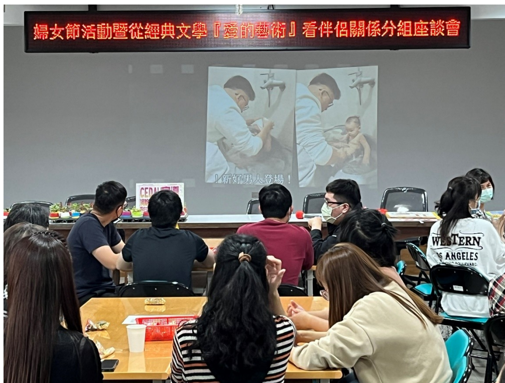
播放本所自製「破除性別刻板印象-替代役超級奶爸篇」宣導影片

課後「課程需求評估問卷」回應，有關「課程滿意度調查」滿意者+非常滿意者均在 90%以上及「學習成效調查」同意者+非常同意者亦占 90%。(詳見附件臺南市歸仁區公所 112 年性別意識培力課程「從經典文學『愛的藝術』看伴侶關係」分組座談會暨婦女節性別宣導活動滿意度與學習成效調查問卷)