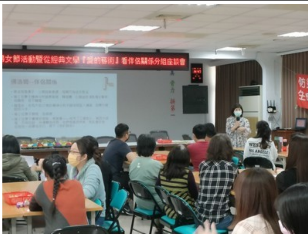
講師講述從性別觀點看佛洛姆的伴侶關係