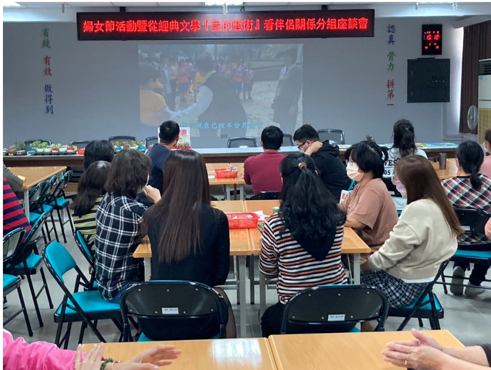
播放「性別不歧視 你我有共識」宣導影片