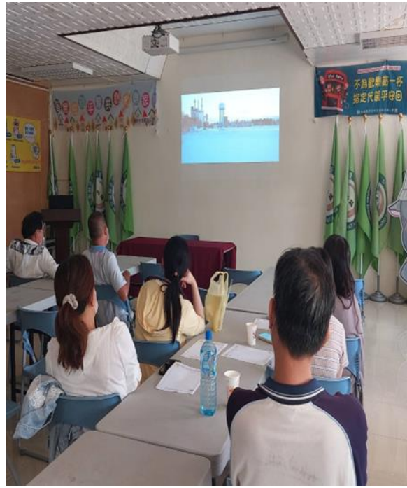
北國性騷擾影片賞析及心得回饋