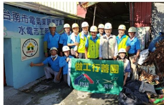
做工行善團修繕完成二百廿三戶修繕戶。(勞工局提供)