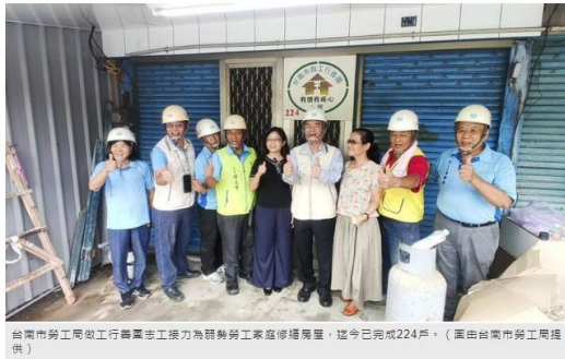
台南市做工行善團志工接力為弱勢勞工家庭修繕房屋，迄今已完成224戶。