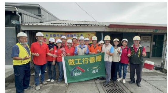
▲海葵颱風侵台 做工行善團馬不停蹄趕工修繕。

颱風季節來臨，近期颱風接連不斷成形，本市更面臨蘇拉、海葵與鴻雁三股環伺，台南市勞工局為了讓勞工早日重返家園，落實食哲市長「善鄰家園」的願景，與「做工行善團」修繕志工馬不停蹄地與弱勢勞工修繕房屋，本周8/30先到永康進行修繕評估作業，今日(09/03)由泥水工會志工前往左鎮區，進行臥室地板貼磁磚美化施工，期許將案家打造一個乾爽安心的環境，油漆工會志工也到場勘量以便適時下週即修粉刷新。