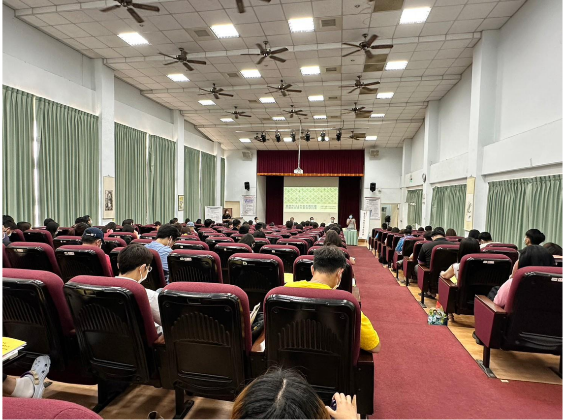
檢察官講述實務案例及處理情形