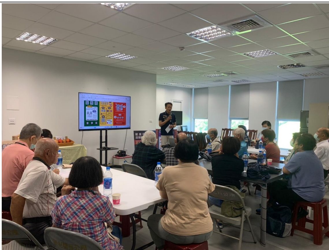
檢察官講述實務案例及處理情形