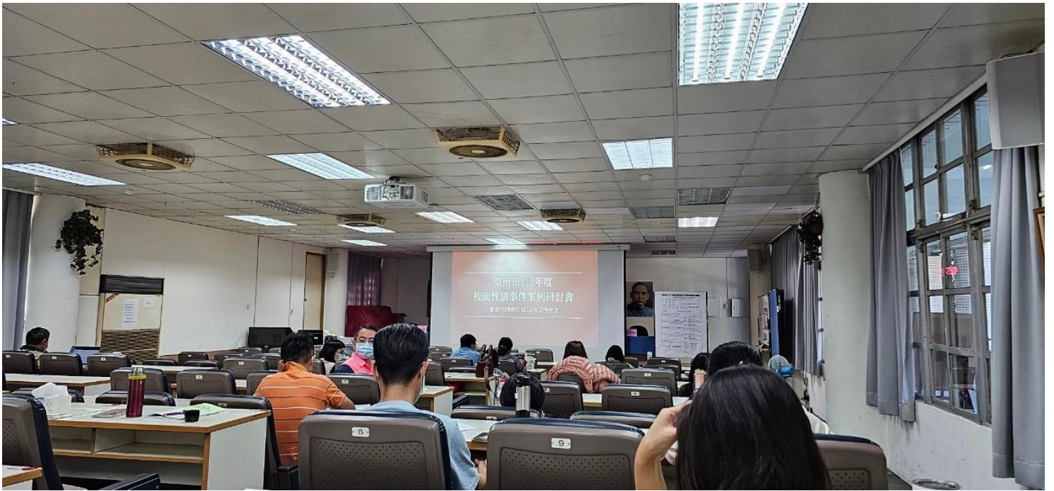
律師聯合會理事長講述實務案例及處理情形