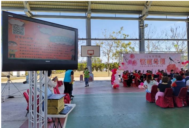
活動現場於電視播放登月計畫簡報