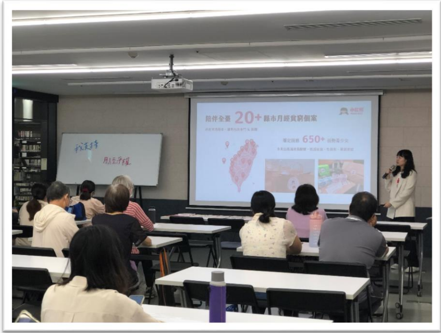
112年本府性別平等辦公室邀請 全球小紅帽協會辦理專題講座