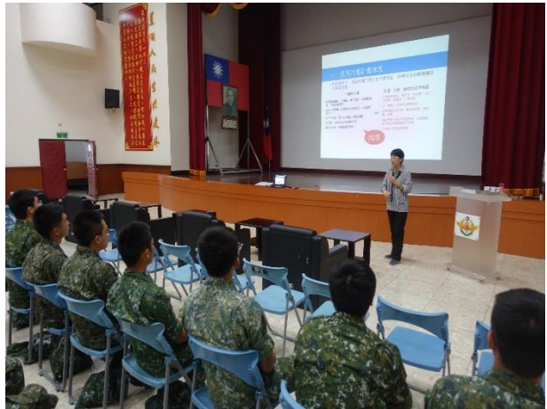
於軍方辦理性平講座宣導