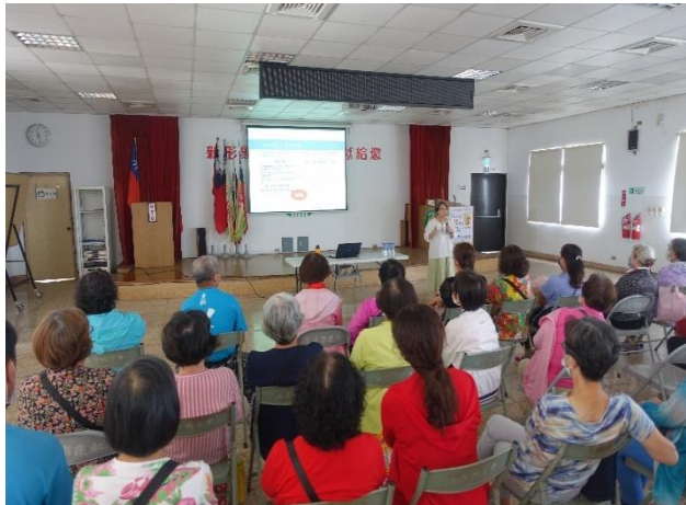
於農會辦理性平講座宣導