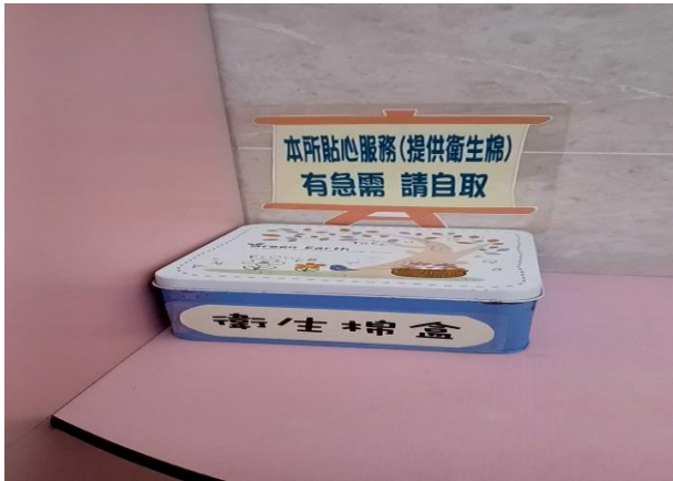
公廁放置生理用品提供民眾使用