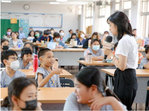
學校宣講月經教育課程