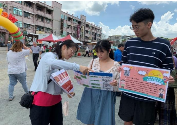
活動設攤向民眾宣導