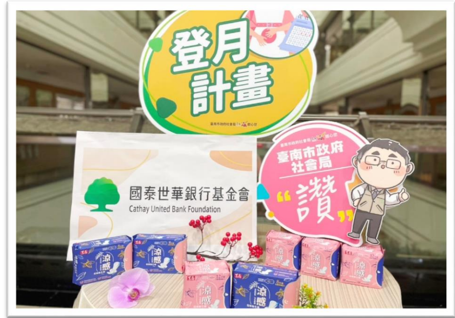
112年國泰世華銀行基金會捐助臺南市 政府社會局及教育局生理用品