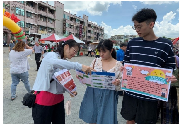
活動設攤向民眾宣導