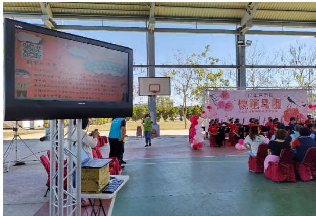
活動現場於電視播放登月計畫簡報