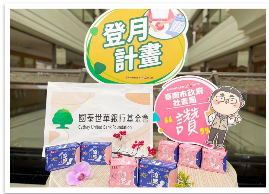
112 年國泰世華銀行基金會捐助臺南市 政府社會局及教育局生理用品