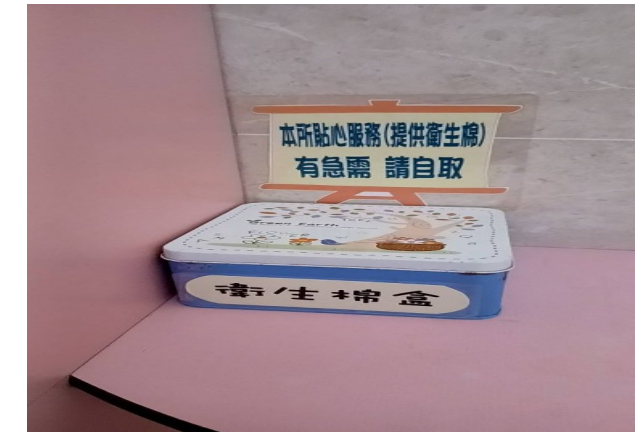
公廁放置生理用品提供民眾使用