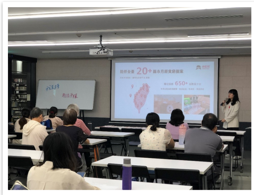
112 年本府性別平等辦公室邀請 全球小紅帽協會辦理專題講座