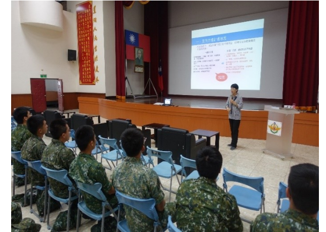
於軍方辦理性平講座宣導