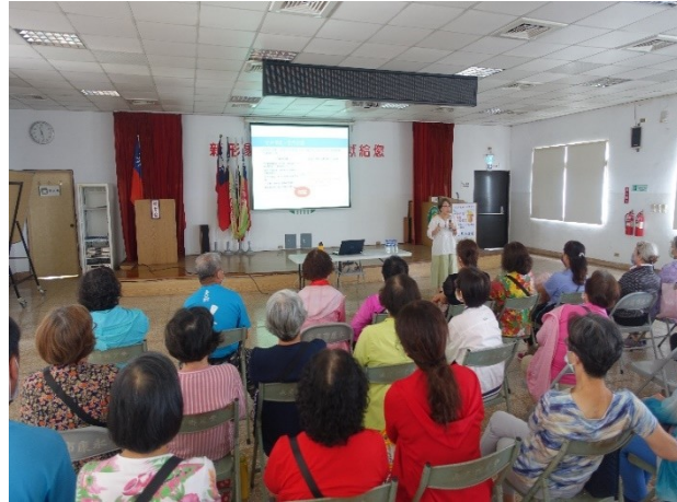
於農會辦理性平講座宣導