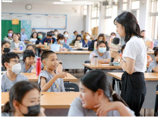
學校宣講月經教育課程