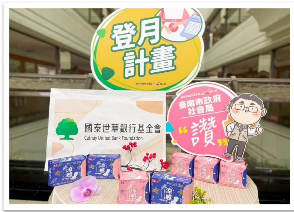
112 年國泰世華銀行基金會捐助臺南市 政府社會局及教育局生理用品