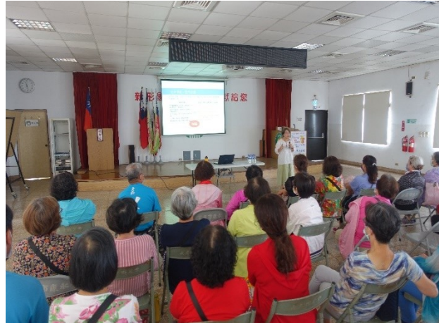
於農會辦理性平講座宣導