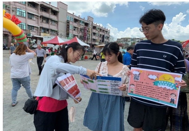
活動設攤向民眾宣導