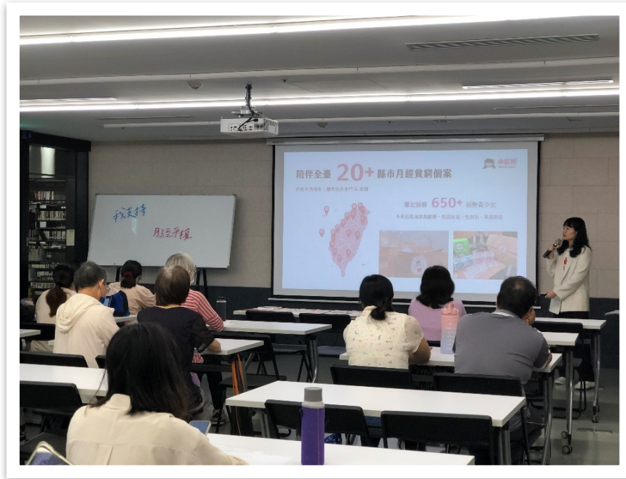
112 年本府性別平等辦公室邀請 全球小紅帽協會辦理專題講座