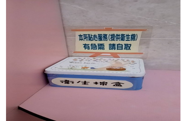
公廁放置生理用品提供民眾使用