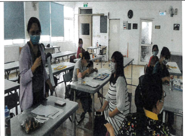
說明:學員與老師互動分享