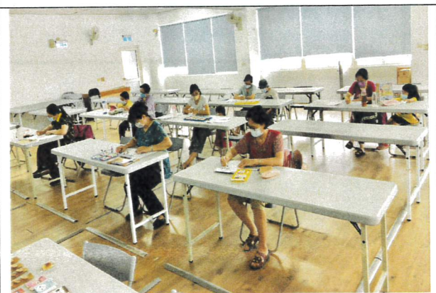
說明:課間小作業，畫出自己的孩子