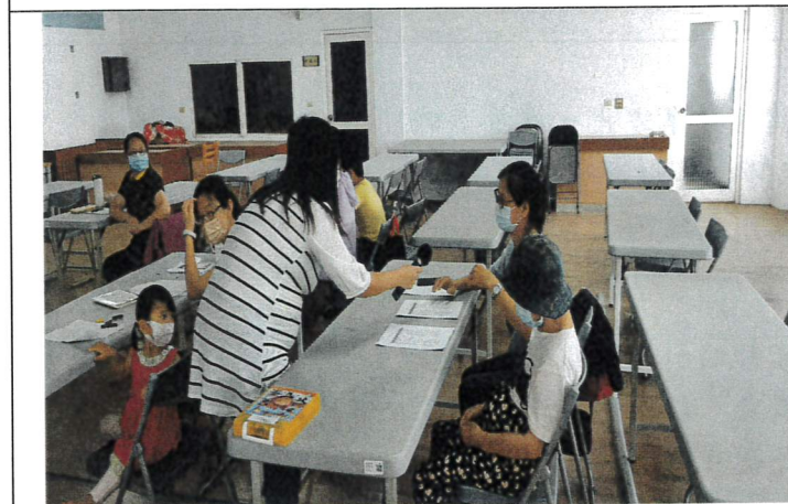
說明:老師詢問學員背景