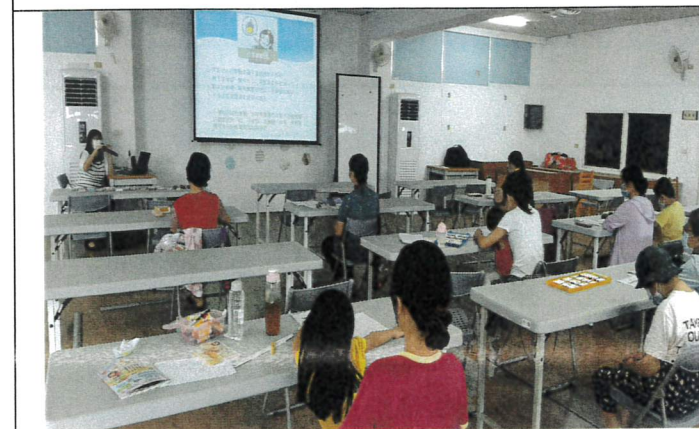
說明:講解針對不同氣質的育兒策略