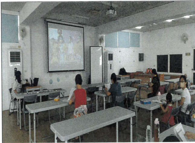
說明:課前播放家庭教育中心宣導影片