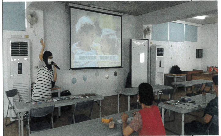
說明:課程開始，老師自我介紹