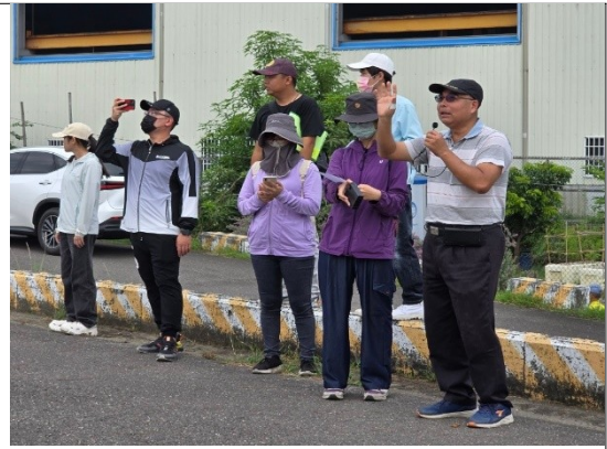
長官介紹與會來賓及志工代表