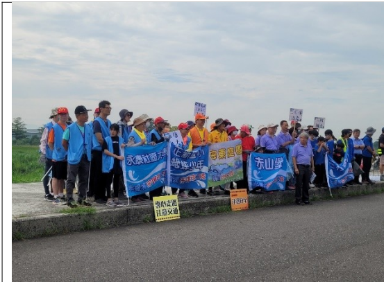
巡守隊淨溪安全教育訓練