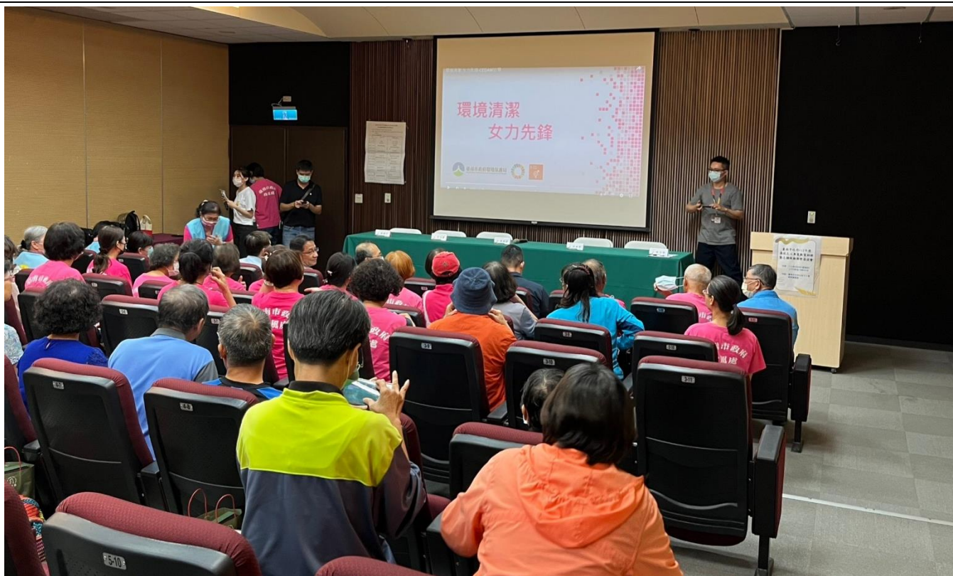
與會者觀看本府「環境清潔·女力先鋒」(本府環境保護局版)CEDAW 宣導影片情形