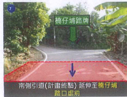
工程範圍現況土地使用情形示意圖 3