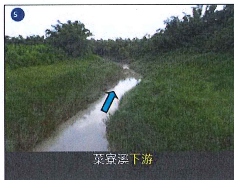
工程範圍現況土地使用情形示意圖 2