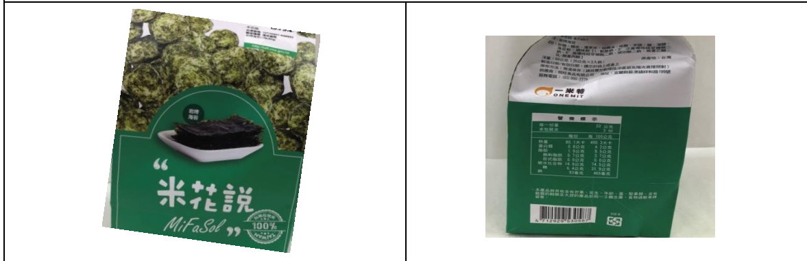
2. 完整包裝產品(內包裝)正反面