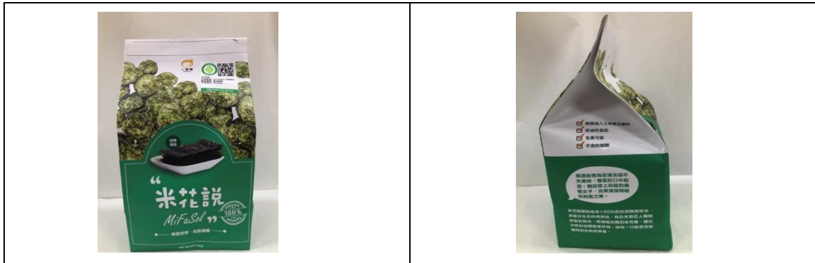
1. 完整包裝產品(禮盒外觀)正反面