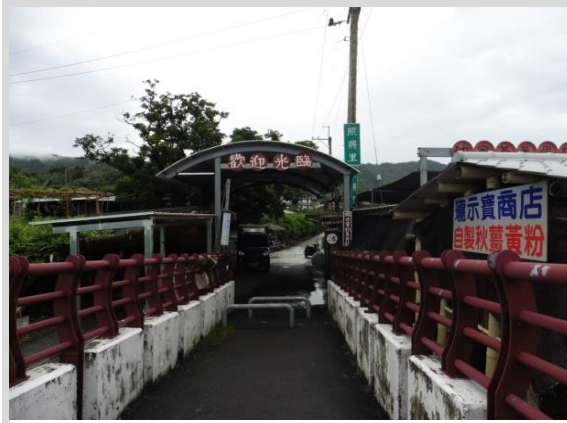
永興吊橋照興里入口處