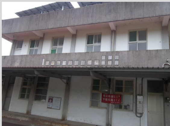
龜丹社區活動中心