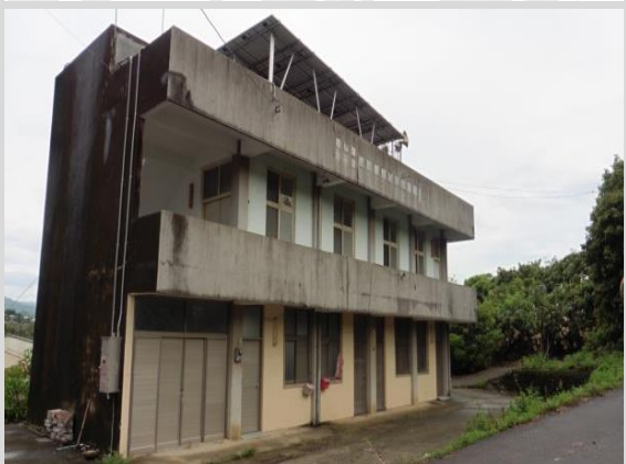
照興社區活動中心