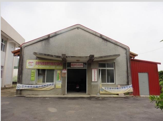
鹿田里休閒活動中心