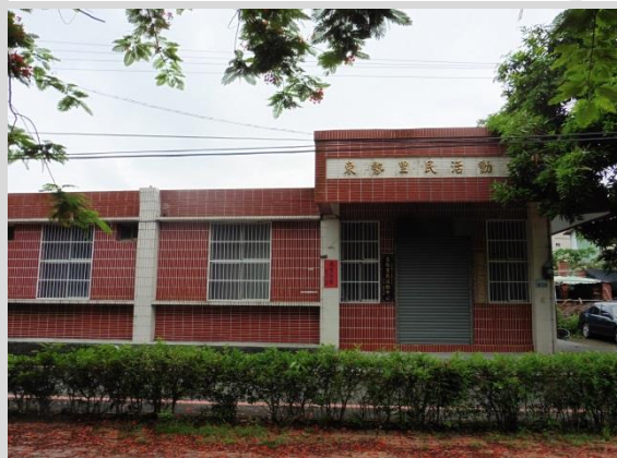
東勢里民活動中心