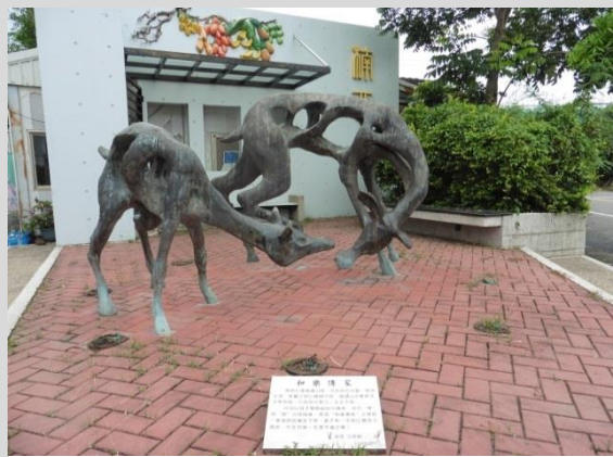
入口意象－和樂傳家