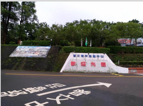
曾文青年活動中心