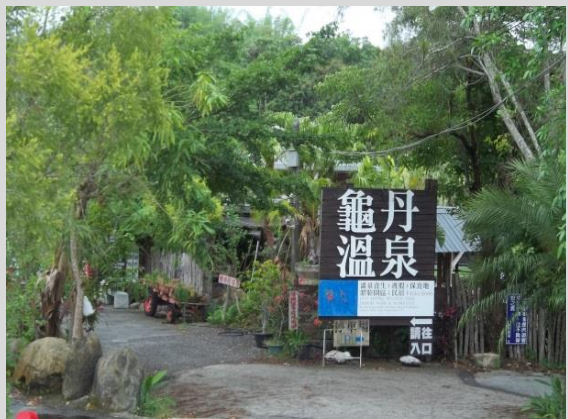
龜丹溫泉休閒體驗農園