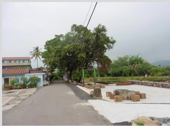
油車聚落及休閒公園