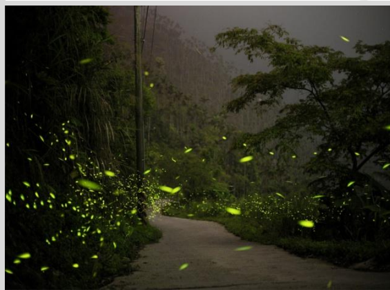
每年 4-5 月賞螢季