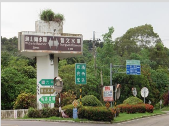
照興里圓環指標處