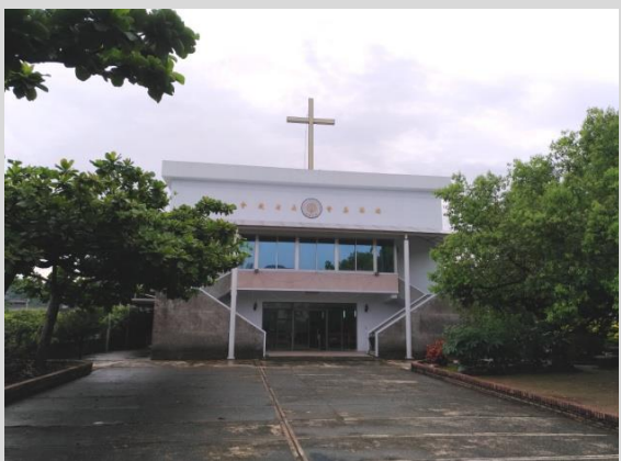
基督教長老教會楠西分會