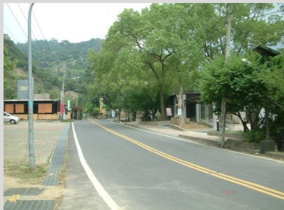
南 188 區道