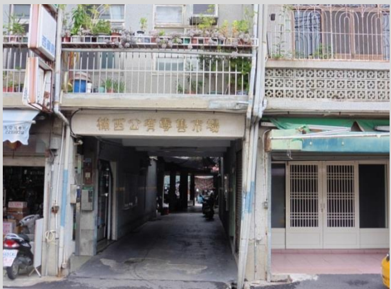
楠西公有零售市場